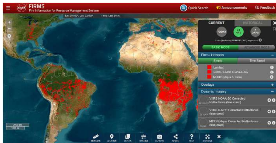
Gambar 1.1 Website FIRMS