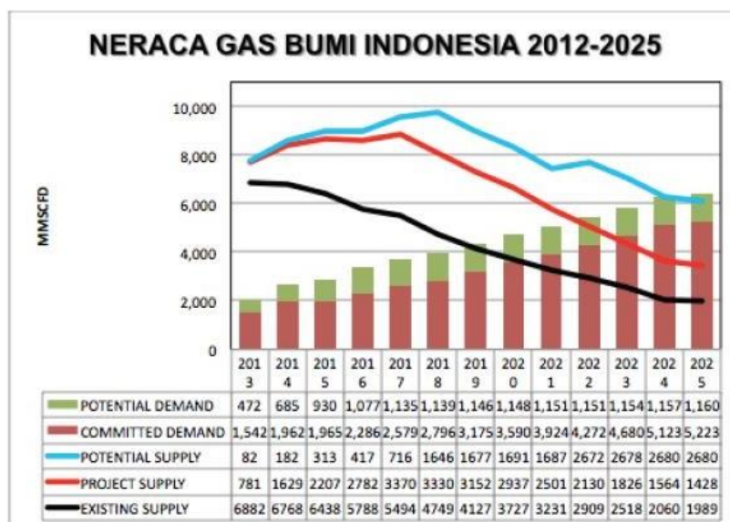
Gambar 1.2 Kondisi gas bumi

Industri pupuk menggunakan gas alam sebagai bahan baku dalam proses pembuatan pupuk, sedangkan pada keempat industri lainnya, gas alam digunakan sebagai sumber energi. Menurut Peraturan Menteri No. 3 Tahun 2010 Pasal 6 Ayat 3 yang mengatur alokasi dan pemanfaatan gas alam, industri pupuk mendapatkan prioritas dalam alokasi gas alam, yang berarti alokasi untuk industri lain mungkin dapat digantikan dengan sumber energi lain