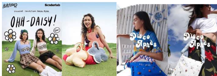
Gambar 1 Rancangan Layout

Layout digunakan untuk penentuan tata letak dari suatu elemen visual baik itu tata letak tipografi, ilustrasi, teks beserta elemen pendukung desain lainnya. Tampilan visual ini diharapkan lebih komunikatif kepada audiens dan mengerti pesan apa yang ingin disampaikan.