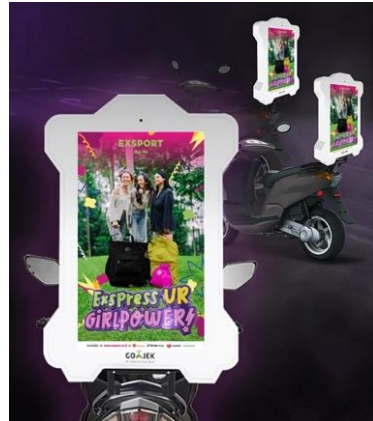
Gambar 6 GoScreen

Selain iklan OOH di Halte MRT Bundaran HI dan Blok, penggunaan iklan Ojek Online (GoScreen) juga dilakukan guna memaksimalkan tahap Attention ini untuk mengundang perhatian target audiens jauh lebih banyak lagi.