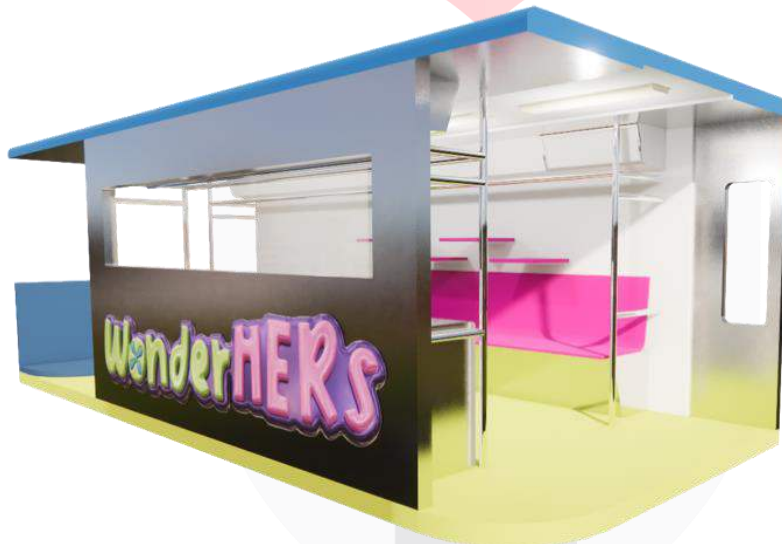
Gambar 15 Event sekaligus Pop Up Booth

Brand activation yaitu event sekaligus pop up booth brand Exsport yang bernama “WonderHERs” mempunyai beberapa kegiatan acara yaitu display produk, karaoke dan Talk Show oleh role model perempuan Indonesia dalam bergaya hidup maupun fesyen untuk menarik perhatian target audience yaitu Tasya Kisty dan Dilla Probokusumo yang sesuai dengan tagline nya sendiri “Express UR GIRLPOWER!” tentang perjalanan mereka sebagai perempuan