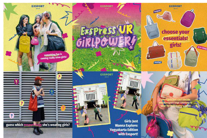
Gambar 7 Instagram Feeds Attention

Selain iklan OOH di Halte MRT Bundaran HI dan Blok, penggunaan iklan Ojek Online (GoScreen) juga dilakukan guna memaksimalkan tahap Attention ini untuk mengundang perhatian target audiens jauh lebih banyak lagi.