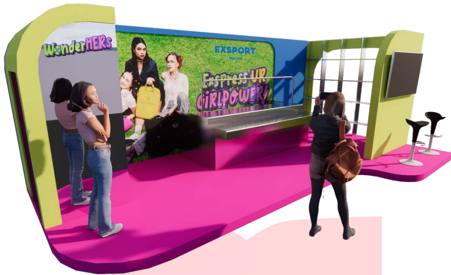
Gambar 14 Event sekaligus Pop Up Booth