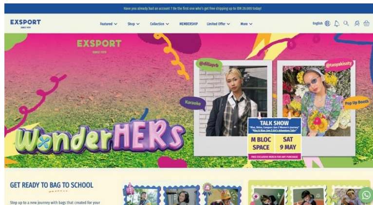
Gambar 12 Website resmi

Target audiens memiliki potensial untuk mencari informasi yang lebih lagi terhadap brand Exsport maupun event sekaligus pop up booth yang ingin dilaksanakan nanti dan besar kemungkinan mereka melakukan pencarian online, seperti Instagram, Tik Tok, maupun website resmi brand Exsport sendiri.