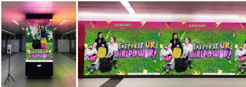
Gambar 5 OOH di Halte MRT Bundaran HI dan Blok M

Pada tahap Attention , brand Exsport akan menggunakan media pendukung yaitu OOH di Halte MRT Bundaran HI, Blok M, dan Ojek Online (GoScreen) yang sering digunakan oleh target audiens dan berguna untuk menarik perhatian para target audiens yang akan dituju.