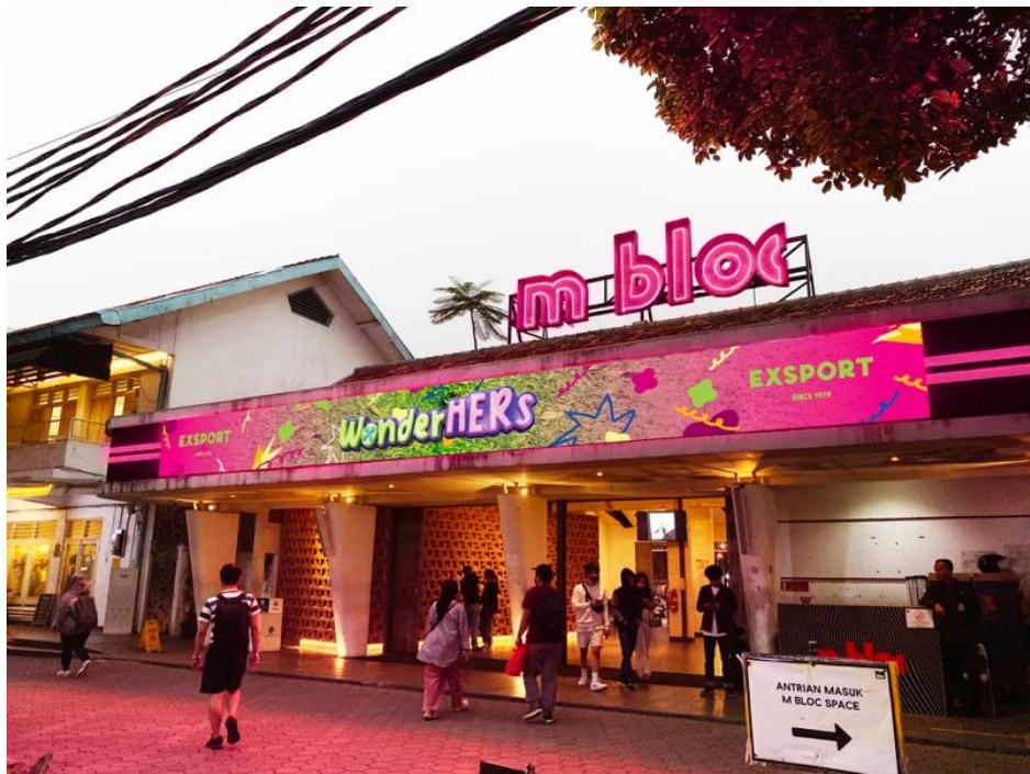
Gambar 13 Pintu Masuk M Bloc Space