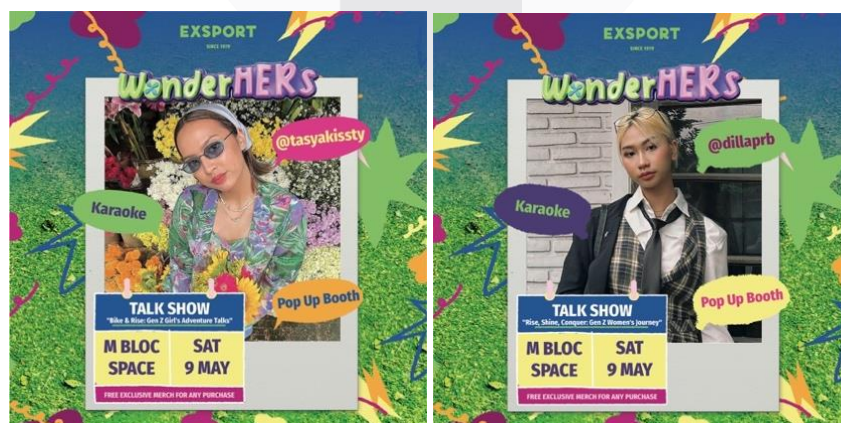
Gambar 9 Instagram Feeds Interest

Tahap Interest brand Exsport ingin memberi tahu masyarakat Kota Jakarta jika event sekaligus pop up booth brand Exsport ini akan diadakan dengan menggunakan media pendukung OOH lagi di Billboard daerah Blok M dan Mobile LED.