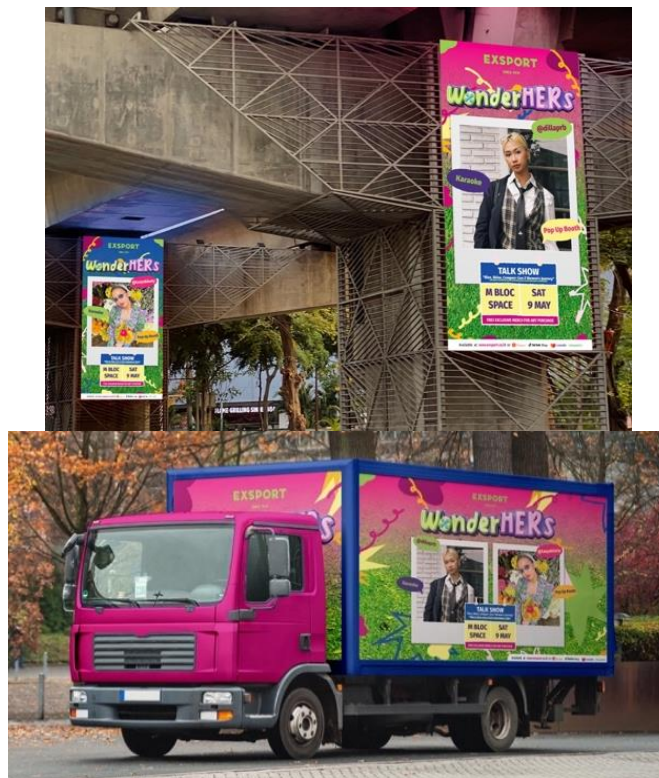
Gambar 8 Billboard Blok M dan Mobile LED

Tahap Interest brand Exsport ingin memberi tahu masyarakat Kota Jakarta jika event sekaligus pop up booth brand Exsport ini akan diadakan dengan menggunakan media pendukung OOH lagi di Billboard daerah Blok M dan Mobile LED.