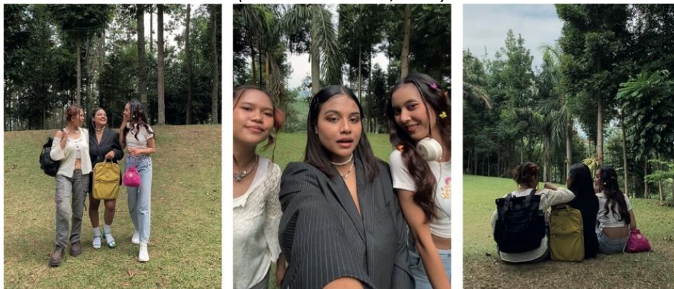
Gambar 10 Video TikTok

Tak hanya itu, media sosial pun digunakan untuk memaksimalkan penyebaran Informasi terkait event sekaligus pop up booth brand Exsport ini akan diadakan pada bulan mei di M Bloc Space Jakarta Selatan seperti Instagram dan TikTok