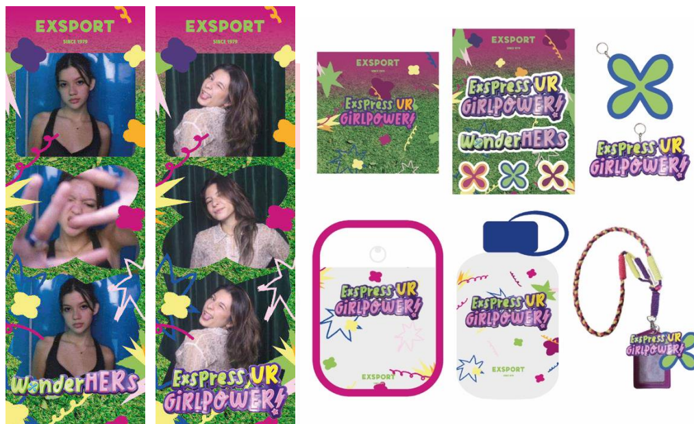
Gambar 16 Strip Photobooth dan Merchandise

Setelah para target audience mendatangi event sekaligus pop up booth brand Exsport “WonderHERs” ini tahap terakhir yang mendorong mereka membagikan pengalaman mereka selama mendatangi event sekaligus pop up booth brand Exsport “WonderHERs” di sosial media mereka masing-masing. Selain itu para target audiens pun mendapatkan merchandise eksklusif setiap pembelian produk tas brand Exsport dan photobooth di event tersebut.