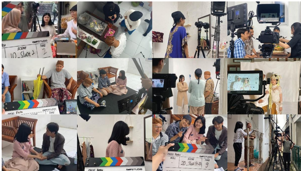
Gambar 1 Proses Produksi

Lalu peralatan yang digunakan berupa alat yang dimiliki pribadi oleh penulis dan tim dan juga alat yang sewa karena kebutuhan tambahan yang harus dimiliki ketika pada saat proses syuting berlangsung.