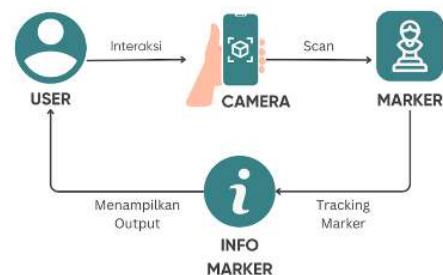
Gambar 1. Arsitektur aplikasi

Aplikasi Android yang dirancang diberi nama AR NuArt, Arsitektur aplikasi yang akan dibangun terdiri dari beberapa komponen. Pengguna mengarahkan kamera aplikasi pada marker sehingga dapat terdeteksi. Kemudian kamera akan melakukan tracking pada marker untuk mengidentifikasi, selanjutnya sistem akan menampilkan output kepada pengguna berupa info objek karya patung seperti gambar, deskripsi dan audio .