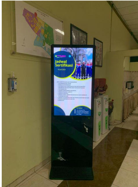
Gambar 1.4 Digital Signage di gedung Migas 1

Gambar di atas merupakan digital signage lainnya yang ada dalam gedung Migas 1, dengan isi konten informasi yang masih sama dengan digital signage yang ditempatkan di gedung lainnya. Begitu juga dengan digital signage yang ditempatkan di gedung PTSA, kantor besar dan open space seperti yang ada di bawah ini.