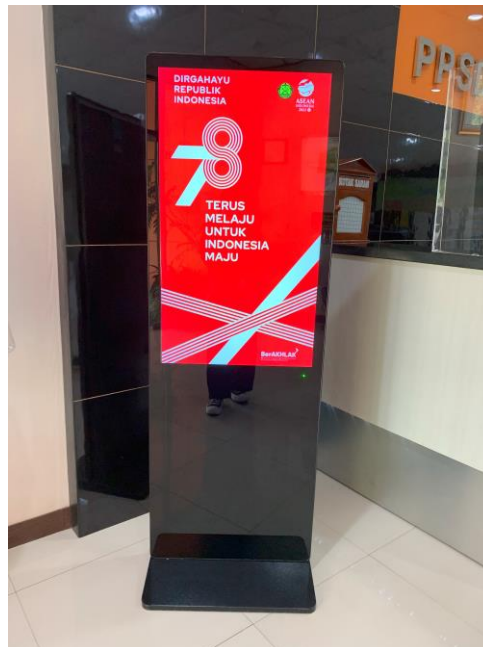
Gambar 1.5 Digital Signage di gedung PTSA

Gambar di atas merupakan digital signage lainnya yang ada dalam gedung Migas 1, dengan isi konten informasi yang masih sama dengan digital signage yang ditempatkan di gedung lainnya. Begitu juga dengan digital signage yang ditempatkan di gedung PTSA, kantor besar dan open space seperti yang ada di bawah ini.