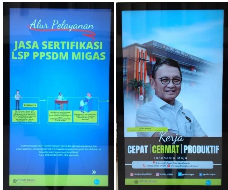
Gambar 1.2 Digital Signage PPSDM Migas

ASN, dan lain sebagainya dengan pesan yang informatif dan edukatif tanpa adanya fitur atau wadah bagi khalayak untuk memberikan timbal balik secara langsung.