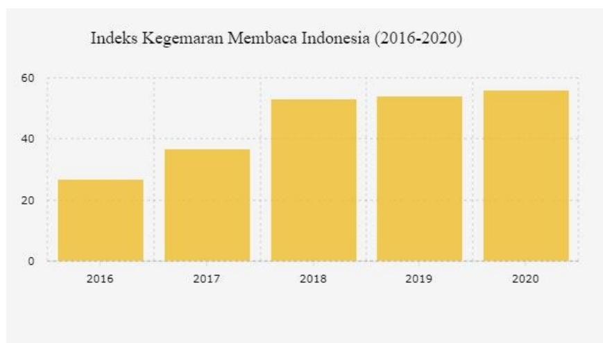
Gambar 1.8 Indeks Kegemaran Membaca di Indonesia

Informasi yang ditampilkan dalam digital signage PPSDM Migas berupa gambar dan juga tulisan berupa kata-kata yang perlu dipahami oleh pembaca yang membutuhkan informasi. Namun mengutip dari laman perpustakaan Kementerian Dalam Negeri (2021), tingkat literasi masyarakat Indonesia berada di urutan ke 62 dari 70 negara atau dalam kata lain, Indonesia masuk dalam 10 negara terbawah yang memiliki tingkat literasi rendah. Untuk mengatasi hal tersebut berbagai cara perlu dilakukan oleh penyedia informasi untuk memberikan kemudahan agar masyarakat bisa mendapatkan informasi dengan cepat. Salah satu bentuk usaha untuk menarik minat baca di kantor PPSDM Migas adalah dengan penggunaan digital signage . Selaras dengan laman perpustakaan kemendagri, artikel dalam laman Kementerian Komunikasi dan Informasi (2017) juga menyebutkan bahwa menurut UNESCO, hanya 0,0001% orang atau hanya 1 orang yang berminat membaca dari 1000 orang di Indonesia (Evita Devega, 2017).