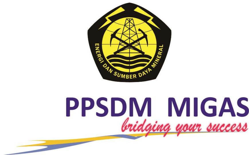
Gambar 1.1 Logo PPSDM Migas

Kepala Badan Diklat ESDM mengawasi pekerjaan yang dilakukan PPSDM Migas. Surat Keputusan No. 150 Tahun 2001, tanggal 2 Maret, menyatakan demikian. Sesuai revisi terakhir Peraturan Menteri ESDM No. 13 Tahun 2016 Tanggal 20 Juli 2016, PPSDM Migas bertugas membina Sumber Daya Manusia di bidang Migas.