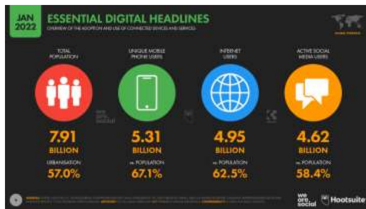
Gambar 1. 5 Hootsuite, We are Social Essential Digital Headlines

Media sosial adalah saluran komunikasi online yang dibentuk berdasarkan komunitas, interaksi, berbagi konten, dan kolaborasi (Cheng, 2019). Pemakaian media sosial dapat menguntungkan dalam berbagai macam aspek. Mulai dari untuk produktivitas kerja, untuk mempromosikan suatu brand hingga meraih brand community dan loyalty dari para audiens. Oleh karena itu, pemakaian media sosial menjadi hal yang tidak bisa dilepaskan dari kehidupan sehari-hari. Data dari We Are Social dan Hootsuite untuk pemakaian media sosial secara global pada tahun 2022 menunjukkan lebih dari 4.62 miliar orang atau 58,4% dari jumlah penduduk dunia. Hal ini menunjukkan adanya peningkatan 4,8% lebih banyak daripada tahun 2021 yang berjumlah 4.20 miliar orang.