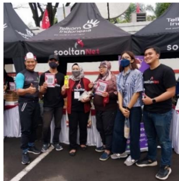
Gambar 1.4 Dokumentasi Bazaar UMK Binaan Telkom Indonesia Pada HUT Telkom Ke-57

Sebagai leading perusahaan telekomunikasi di Indonesia, Telkom mengedepankan teknologi digital dalam melaksanakan CSR, salah satunya program kemitraan UMK. Beberapa kegiatannya seperti pengembangan digital platform UMK, pembentukan UMK Millennial, serta meningkatkan kapasitas mitra binaan mengacu pada pendekatan “ Go Modern - Go Digital - Go Online - Go Global ”. Kemudian Telkom juga menyediakan infrastruktur, platform, hingga layanan digital sebagai bagian strategi CSR agar menghasilkan UMK yang selaras dengan perkembangan zaman. Namun nyatanya, ekosistem digital masih terasa asing bagi sebagian masyarakat. Kapabilitas masyarakat merupakan hal krusial dalam menghadapi masalah ini. Meskipun Telkom memberikan pelatihan digitalisasi pada UMK, tetap diperlukan evaluasi lebih lanjut agar mitra binaan dapat memberikan umpan balik. Melalui evaluasi ini, perusahaan dan mitra binaan dapat memahami kendala satu sama lain.