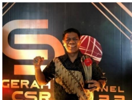
Gambar 1.3 Telkom Indonesia Raih Kategori Economic Development Initiatives melalui Program Digitalisasi UMK

Mengacu pada program SHARE, Telkom berfokus pada program digitalisasi. Terdapat kluster-kluster yang dioptimalkan diantaranya Kluster Digital Pendidikan, Kluster Digital UMK, serta Kluster Masyarakat Digital. Salah satu kluster yang telah mendapatkan penghargaan melalui rangkaian program digitalisasi adalah kluster Usaha Mikro Kecil. Peraihan penghargaan tersebut menunjukkan kesungguhan Telkom Indonesia dalam memajukan sistem ekonomi modern di Indonesia.