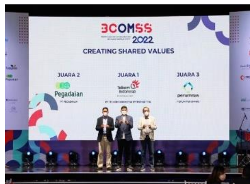
Gambar 1.2 Telkom Indonesia Meraih Juara 1 Creating Shared Value (CSV)

Salah satu bentuk CSR yang sering diterapkan di Indonesia adalah community development . Meskipun CSR bukan semata-mata community development , namun hal ini sesuai dengan situasi dan kebutuhan masyarakat yang masih terjebak kemiskinan. Tingkat pengangguran yang tinggi rendahnya kualitas pendidikan dan kesehatan menjadi faktor utama sulitnya memutus rantai kemiskinan (Saleh & Sihite, 2020). Maka dari itu, perusahaan yang menerapkan konsep ini akan memberikan fokus yang lebih besar pada perkembangan sosial dan penguatan kapasitas masyarakat sehingga mereka dapat mengeksplorasi potensi komunitas lokal sebagai modal sosial perusahaan untuk kemajuan dan pengembangan (Jahidin, Arafah, & Kusnadi, 2023). Dengan demikian, community development akan berfokus pada terbangunnya kemandirian melalui kegiatan pengembangan. Masyarakat tidak hanya diberikan bantuan berupa materi, tetapi juga akses untuk menunjang kemandiriannya. Salah satu perusahaan BUMN yang aktif menyelenggarakan CSR melalui Community Development adalah PT Telkom Indonesia.