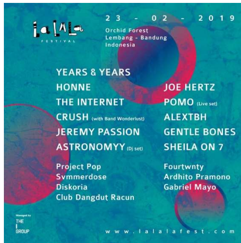
Gambar 1. 1 Logo Lalala Festival 2019