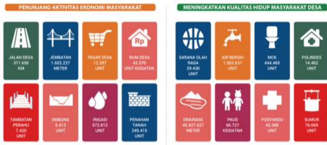
Gambar 2.3 Hasil Pembangunan Desa 2015 -2022

Sumber : https://epaper.kompas.id/pdf/show/20221222