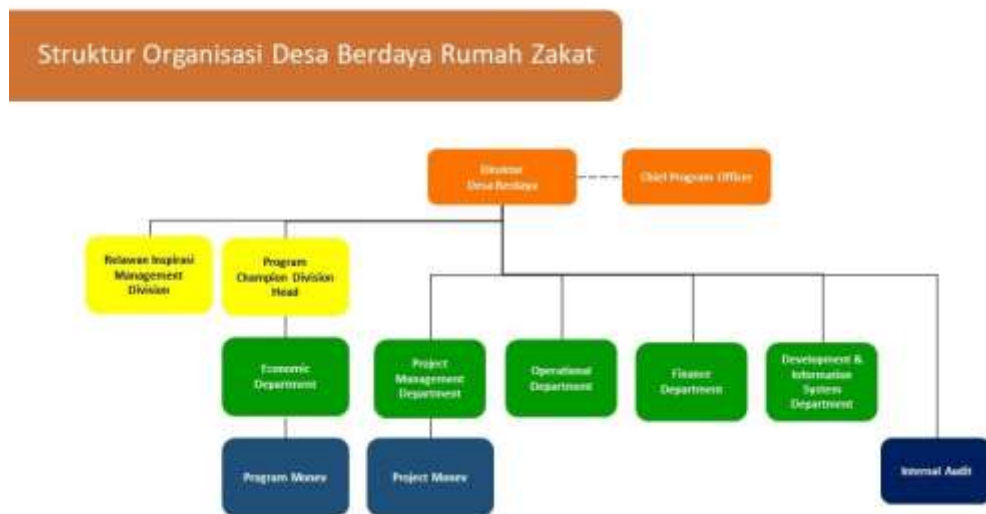
Gambar 1.4 Struktur Organisasi Desa Berdaya