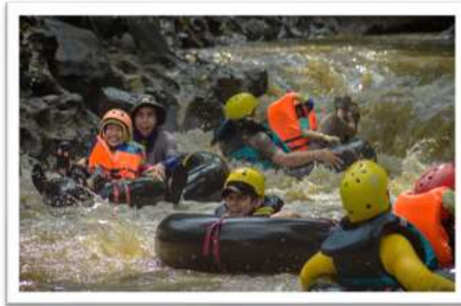
Gambar 1.6 Kegiatan River Tubbing Agri Wisata Cisande