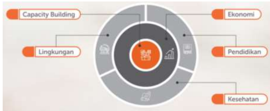
Gambar 1.3 Konsep Desa Berdaya Rumah Zakat

VISI : Menjadi Centre of Excellence dalam pemberdayaan masyarakat yang berdampak sosial dan berkelanjutan