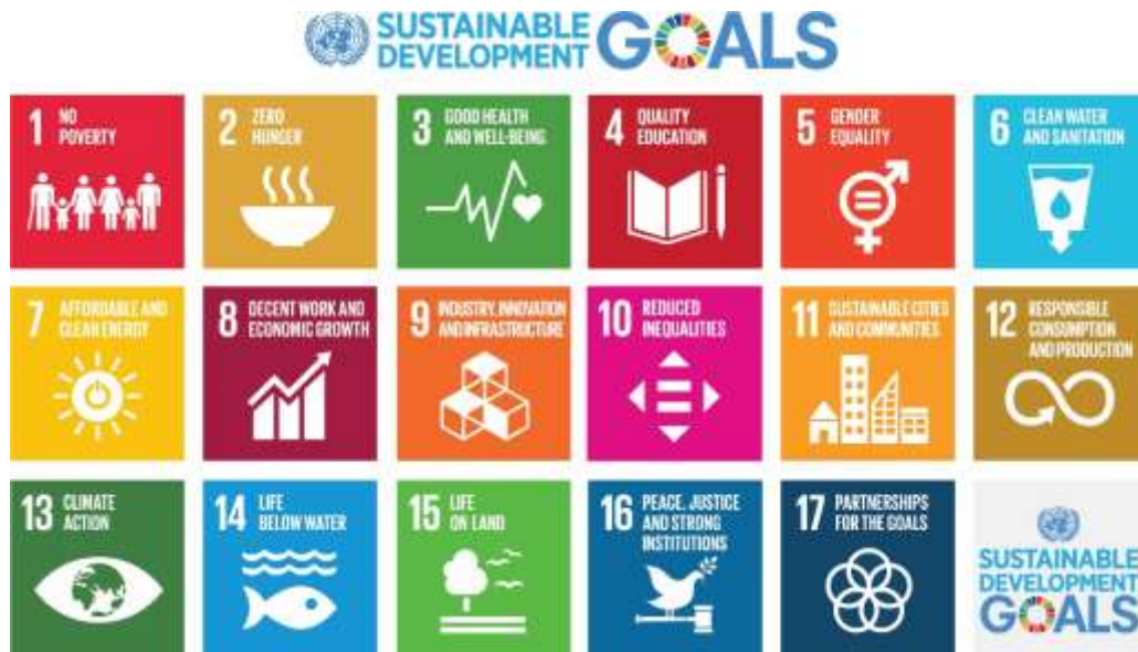
Gambar 2.1 SDGS