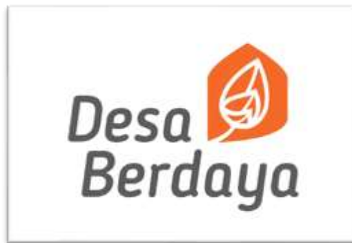
Gambar 1.1 Logo Gerakan Desa Berdaya

Kegiatannya Rumah Zakat telah mendapatkan izin sebagai Lembaga Amil Zakat Nasional sesuai keputusan Menteri Agama RI No. 421 Tahun 2015, serta sebagai Lembaga Kesejahteraan Sosial dari Menteri Sosial RI No. 107/HUK/2014, dalam mengimplementasikan program pemberdayaannya Rumah Zakat mengusung gerakan bernama Desa Berdaya.