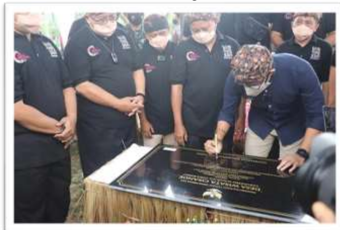
Gambar 1.7 Peresmian Agrowisata Cisande