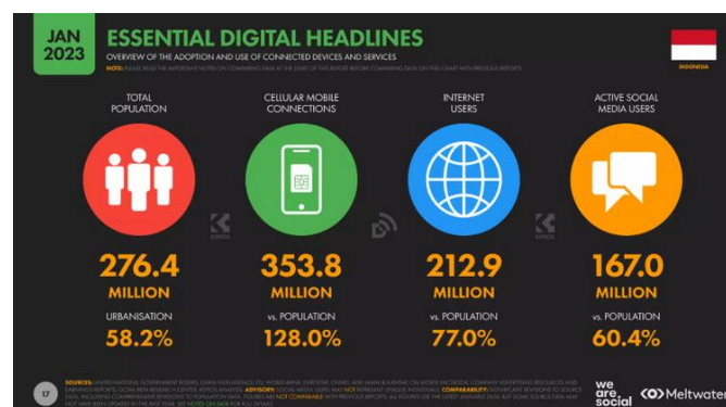
Gambar 1. 2

Salah satu strategi pemasaran online yang digunakan oleh SMB Telkom University adalah melalui media sosial. Menurut Van Dijk dalam Pahlevi (2020:9), media sosial adalah platform media yang memfokuskan pada ekstensi pengguna yang memfasilitasi mereka dalam beraktifitas maupun berkolaborasi. Keberadaan dan pertumbuhan media sosial memberikan banyak manfaat, antara lain memudahkan dalam komunikasi jarak jauh, memungkinkan konsumen mencari informasi dengan cepat, serta memungkinkan produsen untuk memasarkan produk melalui akun media sosial guna menjangkau konsumen secara luas.