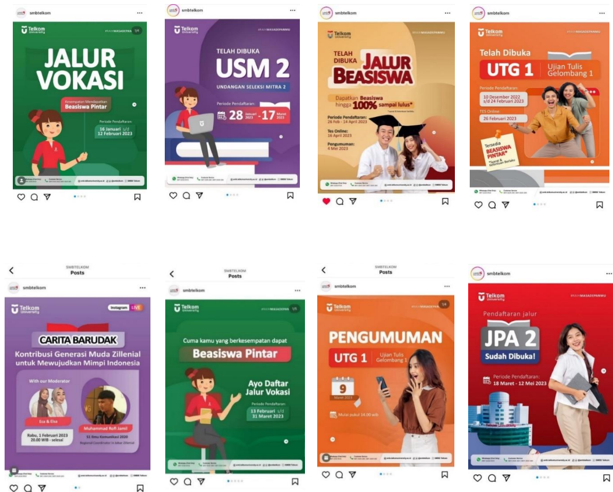
Gambar 1. 4

Dalam era modern seperti sekarang, Instagram telah menjadi platform pemasaran yang tidak hanya digunakan oleh individu, tetapi juga oleh banyak organisasi, institusi, dan universitas. Salah satu contohnya adalah Admisi Nasional yang melakukan pemasaran melalui akun Instagram @smbtelkom, yang memiliki jumlah pengikut sebanyak 87 ribu (data pada 16 Maret 2023). Instagram @smbtelkom menyajikan berbagai konten info pendaftaran, seperti jalur pendaftaran, info penutupan jalur, dan pengumuman pendaftaran serta memuat konten-konten menarik seperti teka-teki (tetew), video pemasaran tentang lingkungan kampus dan info jurusan, live carita barudak ( Talk Show oleh mahasiswa/alumni yang telah berkuliah di Universitas Telkom), Q&A live, dan informasi kegiatan pemasaran seperti kunjungan dan pameran.