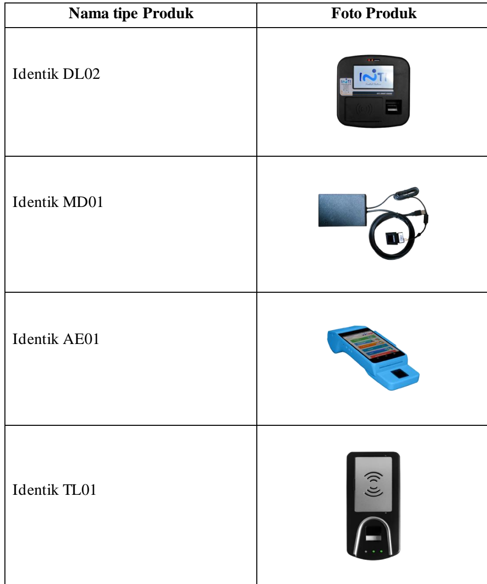
TABEL 1.1 Produk E-KTP Reader PT INTI

Saat ini, PT INTI (Persero) telah memproduksi dan memasarkan empat tipe E-KTP Reader yaitu: