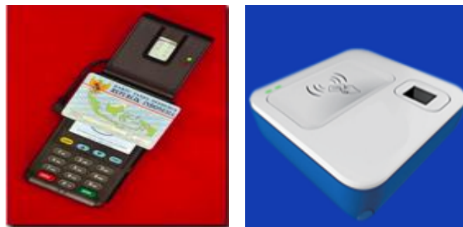
GAMBAR 1.7 Produk Kompetitor E-KTP Reader

Perusahaan ini juga menjadi pesaing bagi PT Industri Telekomunikasi Indonesia. PT IDPRO Bigdata Indonesia dan PT NYRA Sudah banyak menjual produk E-KTP Reader tersebut, yang dimana PT IDPRO Bigdata Indonesia sudah menjual 30% produk E-KTP Reader dan PT NYRA sudah menjual 20% produk E-KTP Reader , sedangkan PT Industri Telekomunikasi Indonesia masih menjual 20% produk E-KTP Reader , untuk Perusahaan Competitor tersebut melakukan penjualan secara langsung ke perusahaan dan dapat menghubungi perusahaan tersebut.