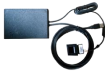
GAMBAR 1.4 Produk E-KTP Reader PT INTI

Dalam buku pedoman Identik PT Industri Telekomunikasi Indonesia (Persero) (2019: 2) komponen INTI Identik DL02 terdiri atas monitor, LED, card Reader dan finger print . Fitur-fitur yang ada di dalam INTI Identik DL02 yaitu verifikasi dan aktivasi, digital signage, raed dan view data, adanya API/SDK dan anti temper juga indikator LED. Menurut pedoman INTI Identik DL02 ini telah melakukan proses verifikasi nilai TKDN oleh PT Surveyour Indonesia untuk perangkat ini sebesar 32,04%.