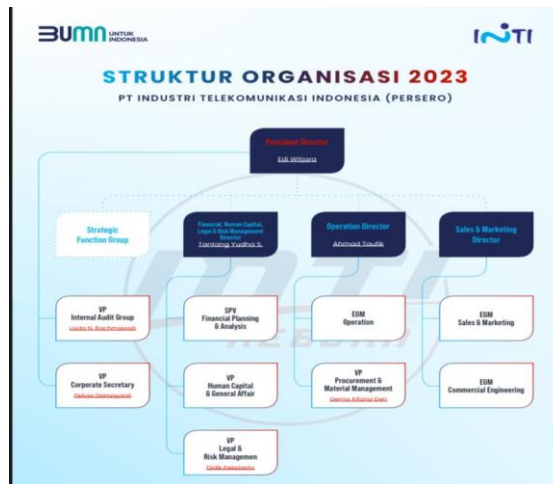
GAMBAR 1.2 Struktur Organisasi PT INTI (Bandung)

Berikut merupakan struktur organisasi dari PT INTI (Bandung) yang merupakan tempat objek penelitian ini :