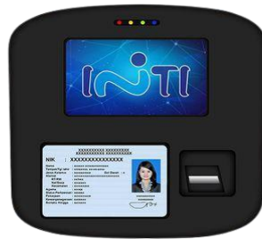
GAMBAR 1.3 Produk E-KTP Reader PT INTI

Jenis-jenis Produk E-KTP Reader yang diberi oleh PT Industri Telekomunikasi Indonesia (Persero), yaitu :