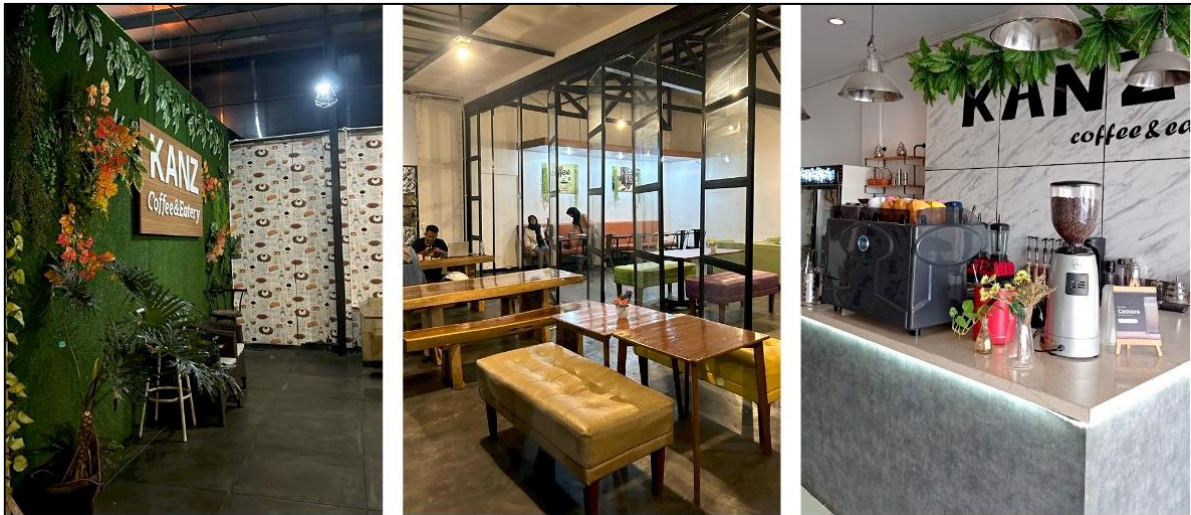
GAMBAR 1. 1

Kanz Coffee and Eatery merupakan salah satu usaha kuliner yaitu café yang menawarkan racikan kopi dilengkapi dengan berbagai macam makanan dan minuman lainnya. Kanz Coffee and Eatery didirikan pada tanggal 3 November 2017. Kanz Coffee and Eatery memiliki konsep ingin menjadikan cafe ini sebagai tempat yang nyaman dan menjadi rumah ke-2 bagi pelanggannya. Kanz Coffee and Eatery didirikan oleh Bapak Ronal dan istrinya Ibu Nefa. Nama Kanz sendiri terinspirasi dari nama anak ke-3 pemilik cafe.