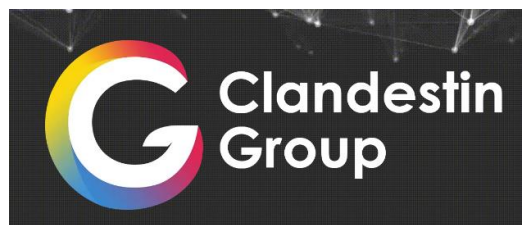
GAMBAR 1. 1 Logo Perusahaan