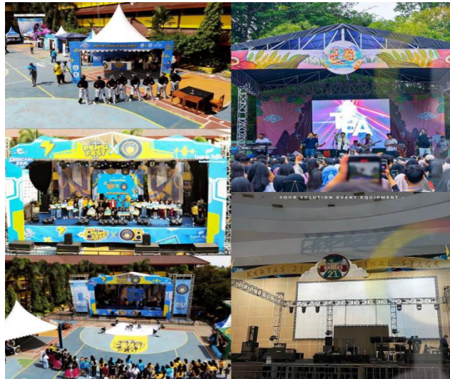
GAMBAR 1. 3 Dokumentasi Acara

client adalah tidak langsung memberi respon contohnya seperti CS lambat dalam memberikan respon kepada customer dan minimnya kerja sama antar tim contohnya adanya complain antara client dan eksekutor vendor dimana komunikasi merupakan masalah utamanya.