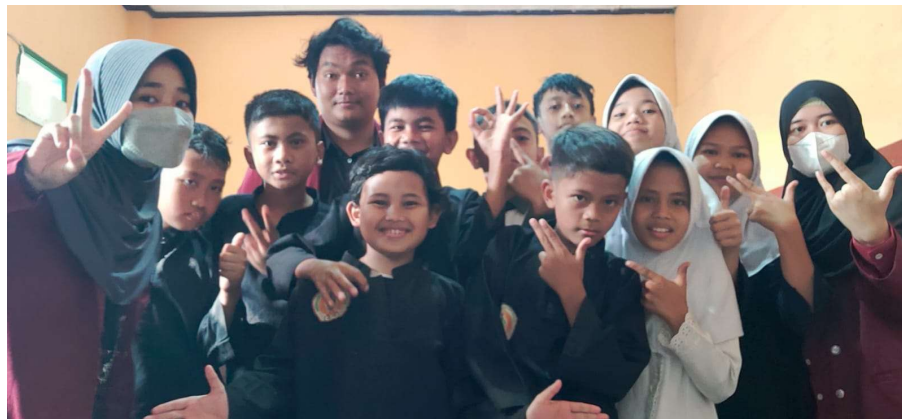
Gambar 1.2 Prngujian di MI Al-Mukhlisin

Sistem ini telah berhasil menjalani tahap pengujian di MI Al-Mukhlisin dengan melibatkan siswa dari kelas 6. Pengujian dilakukan secara menyeluruh di dalam ruangan kelas. Hasil dari pengujian ini bertujuan untuk mengidentifikasi sejauh mana efektivitas dan kinerja sistem dalam konteks penggunaan yang nyata. Dalam lingkungan ruangan kelas, para siswa diberikan kesempatan untuk berpartisipasi dalam proses pengambilan sampel sidik jari, pengolahan data, dan klasifikasi tipe sidik jari. Pengujian ini merupakan langkah penting dalam mengukur respons sistem terhadap situasi penggunaan sehari-hari dan memastikan bahwa sistem dapat berfungsi dengan baik di lingkungan yang relevan.