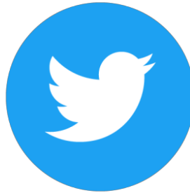
Gambar 1. 4 Logo Twitter

sangat besar. Kemudian menurut Mendoza et al (2022) Twitter adalah satu dari sumber informasi yang sangat populer di dunia yang tersedia di internet.