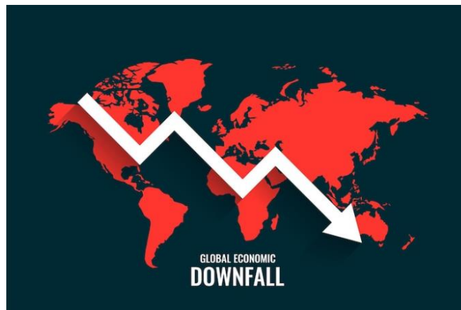
Gambar 1. 1 Ilustrasi Resesi Ekonomi Global 2023

Menurut Friedline et al (2021) resesi memiliki efek yang dipicu dari pandemi global pada saat tahun 2020, yang disebabkan oleh penyebaran coronavirus COVID-19 yang cepat. Bahkan, menurut Coveri et al (2020) Setelah wabah di Cina pada bulan Februari 2020, pandemi menyebar ke seluruh dunia dalam beberapa minggu kemudian. Lockdown dilakukan di beberapa negara sehingga kegiatan produksi ikut terganggu dan memicu krisis ekonomi paling serius sejak Great Recession tahun 2008.