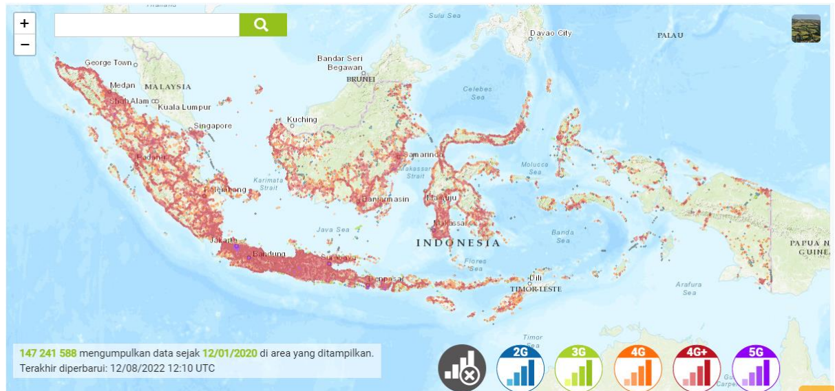
Gambar 1. 3 Peta cakupan 3G/4G/5G Telkomsel di Indonesia