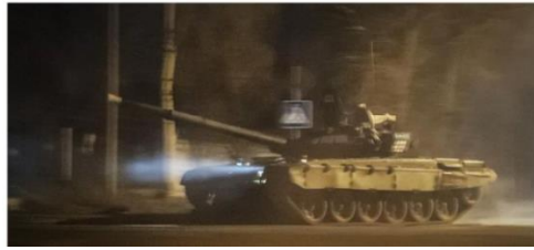
Gambar 1.2 Contoh Kasus Pertama Pemberitaan CNN Indonesia