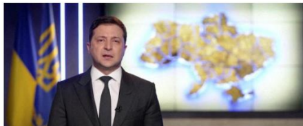
Gambar 1.3 Contoh Kasus Kedua Pemberitaan CNN Indonesia