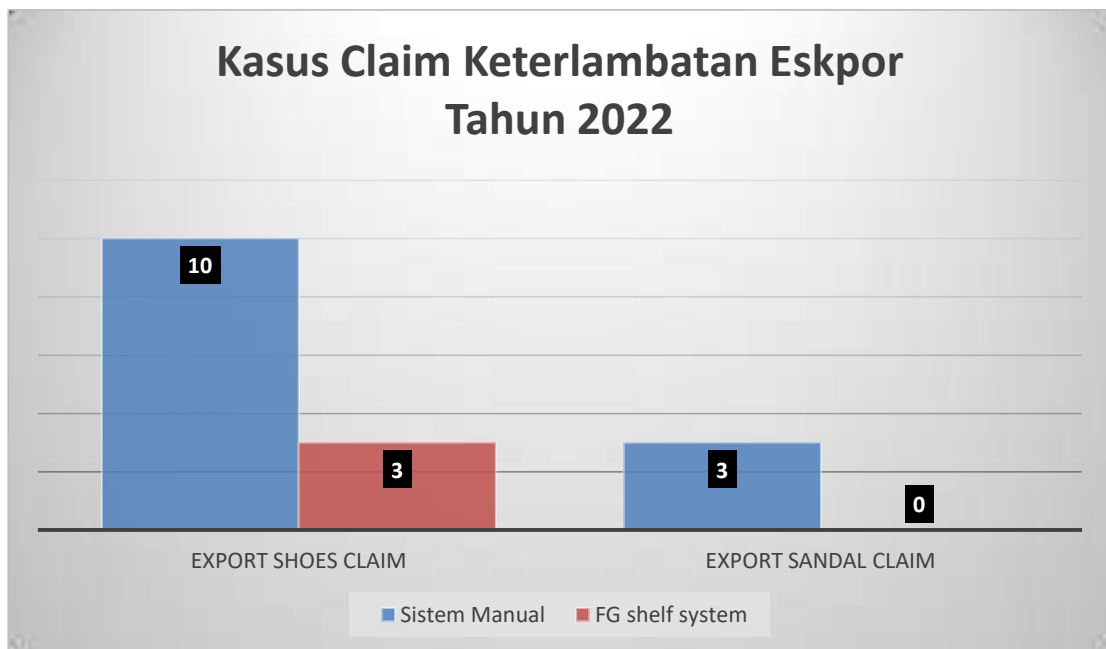
Gambar 1.1 Kasus Claim Keterlambatan Ekspor Tahun 2022

masih bersifat manual. Sistem ini juga memberikan kemudahan dalam pengendalian inventori di finish good warehouse, dimana tim warehouse tidak kesulitan dalam melakukan proses persiapan barang untuk ekspor karena dapat dengan mudah menemukan lokasi lot yang akan di ekspor melalui tracking sistem. Berikut merupakan perbedaan antara pengelolaan inventori yang bersifat manual dan menggunakan sistem finish good shelf arrangement dilihat dari ketepatan jadwal ekspor.