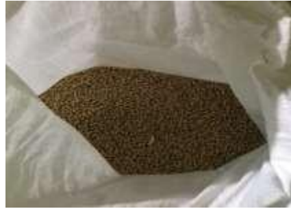
Gambar 5. Bahan Baku Kedelai