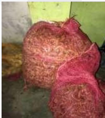
Gambar 6. Bahan Baku Kunyit

Bahan baku berikutnya berasal dari tanaman dalam pengolahannya digunakan oleh pengrajin tahu dalam proses pewarnaan. CV.Laksana menggunakan bahan baku kunyit yang dari para petani yang bernama pak Agus di pasar induk gede bage yang sudah menjadi supplier/pemasok tetap.