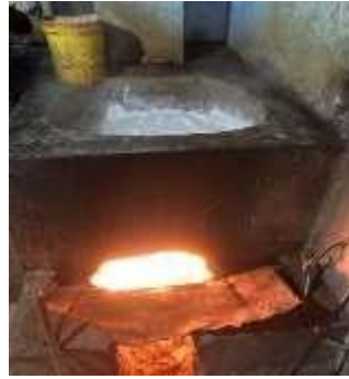
Gambar 11. Proses Penggodokan Kedelai