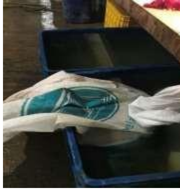
Gambar 9. Proses Perendaman Kedelai