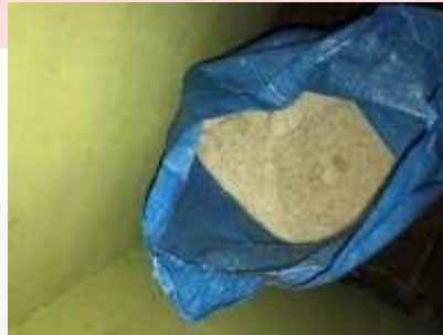
Gambar 5. Bahan Baku Garam

Bahan baku pembuatan tahu selanjutnya berasal dari air laut. Garam krosok yang digunakan oleh CV.Laksana adalah garam grosok yang diolah oleh para petani garam dari daerah Cirebon.