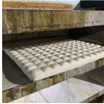
Gambar 13. Proses Pencetakan Tahu