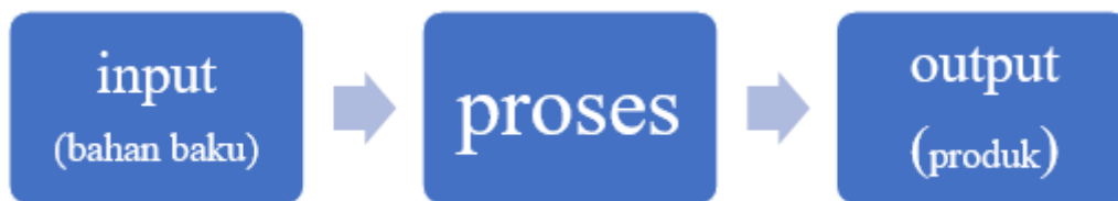
Gambar 3. Tahapan Proses Bisnis

Proses bisnis adalah kegiatan atau serangkaian kegiatan yang mencapai fungsi tertentu. bahwa proses bisnis merupakan serangkaian aktivitas yang dibentuk yang saling bekerjasama dalam sebuah organisasi dan lingkungan teknis. Aktivitas ini dilakukan untuk mencapai suatu tujuan. proses bisnis sebagai struktur, desain aktivitas yang dapat diukur, untuk menghasilkan keluaran (output) untuk pelanggan atau pasar tertentu.