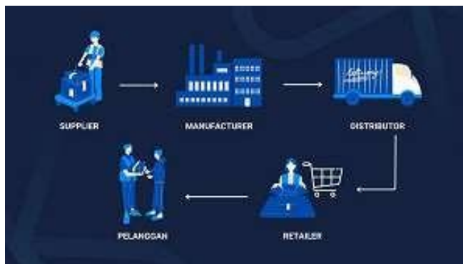
Gambar 2. Tahapan Supply Chain Management

Proses Supply Chain Management (SCM) dapat digambarkan sebagai berikut: