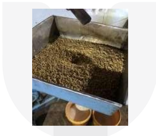
Gambar 10. Proses Penggilingan Biji Kedelai

Biji kedelai tersebut kemudian digiling menjadi bubur kedelai. Penggilingan bertujuan untuk memperkecil ukuran partikel kedelai sehingga akan mempermudah ekstraksi protein kedelai ke dalam susu kedelai. Selama penggilingan dilakukan penambahan air dengan debit 1,8 liter per menit (Purwadi, 2000). Hal ini sesuai dengan pengamatan di industri tahu CV.Laksana Ciparay Kabupaten Bandung yaitu setiap penggilingan 10 kg kedelai kering akan menghasilkan bubur kedelai \pm 25-30 liter dengan berat sekitar 45-50 kg. Jumlah kedelai untuk sekali penggilingan bervariasi ada yang 5kg sekali giling dan ada juga yang 6 kg sekali giling.