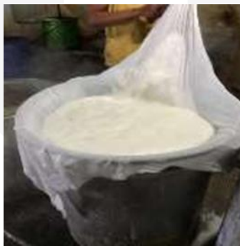
Gambar 12. Proses Memeras Sari Kedelai

Bubur kedelai yang telah dimasak kemudian disaring untuk mendapatkan sari kedelai (susu kedelai). Penyaringan yang umum dilakukan dengan meletakkan bubur kedelai diatas kain belacu (mori kasar) ataupun kainsifon yang sengaja dipasang diatas bak penampung. Kemudian dilakukan pengepresan dengan memberikan papan penjepit dan diberi beban sekuat-kuatnya agar semua air yang berada pada bubur kedelai terperas semua. Bila perlu ampas saringan diperas lagi dengan menambahkan sejumlah air. Menurut pengrajin tahu di CV.Laksana Ciparay, penyaringan dilakukan dengan menaruh bubur kedelai pada keranjang yang dilapisi kain belacu, kemudian diaduk hingga cairannya keluar. Penyaringan dilakukan beberapa kali dengan penambahan sejumlah air untuk mendapatkan sari kedelai yang maksimal. Hasil utama penyaringan ini adalah sari kedelai, sedangkan hasil sampingannya berupa ampas yang banyak digunakan sebagai pakan ternak. Air sari bubur kedelai akan menetes dengan sendirinya ke bak penampung yang sekaligus sebagai bak proses penggumpalan. Setelah air sari bubur kedelai tidak menetes lagi, ampas dari bubur kedelai yang masih mengandung air sari bubur kedelai di- press dengan alat pengepress yang dibuat dari kayu. Hal tersebut dilakukan untuk mendapatkan sisa air sari bubur kedelai yang masih terdapat dalam ampas.