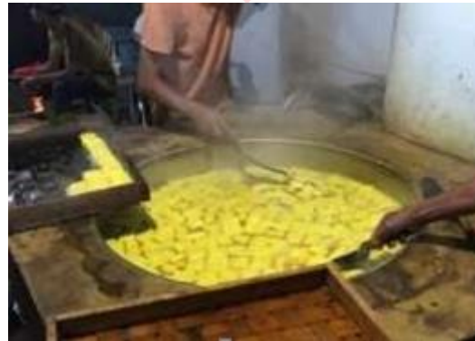
Gambar 14. Proses Penguningan Tahu

Sebelum dipasarkan, tahu yang sudah jadi diberi pewarna dan digarami. Untuk pemberian warna, pengrajin tahu di CV.Laksana menggunakan kunyit alami sebagai bahan bakunya. kunyit alami (kunyit yang digiling oleh mesin) Dari hasil wawancara, Jumlah kunyit yang dipakai adalah \frac{1}{4} kg untuk kunyit gilingan (untuk 4 kali proses pewarnaan).