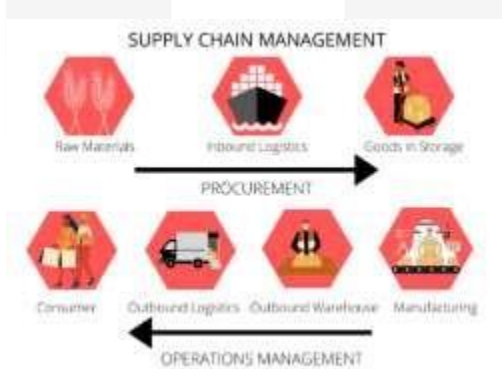
Gambar 1. Aktivitas Supply Chain Management

Supply chain management perlu dikendalikan dengan baik oleh sebuah perusahaan guna menaikkan daya saingnya agar kedepannya kinerja organisasi makin membaik. Organisasi dituntut untuk memikirkan tentang keberadaan dari supply chain management agar dipastikan pengendalian supply chain management tersebut mampu mendorong strategi yang dijalankan oleh perusahaan. Supply chain management terdiri dari beberapa aktivitas, seperti supplier raw material (inbound), manufacturer (production phase), storage (outbound), wholesaler (outbound), retailer (outbound phase), dan end-consumer seperti yang terlihat pada gambar 1 dibawah ini.