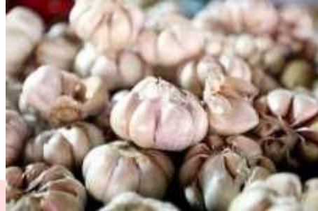
Gambar 7. Bahan Penolong Bawang Putih

Bawang putih merupakan bahan penolong dalam proses produksi tahu yang berasal dari tumbuhan. sebagai bahan penolong untuk menambah rasa harum dalam produksi tahu. CV.Laksana menggunakan bawang putih hanya Ketika ada permintaan dari para konsumen, dan bawang putih yang digunakan di CV.Laksana berasal dari petani atau warung yang menyediakan bawang putih.