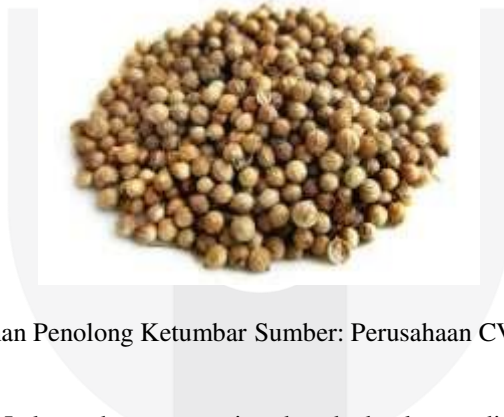
Gambar 8. Bahan Penolong Ketumbar

Sama halnya dengan bawang putih, ketumbar adalah bahan penolong dalam proses pembuatan produksi tahu di CV.laksana untuk menambah rasa berbeda dan tambahan dalam tahu.