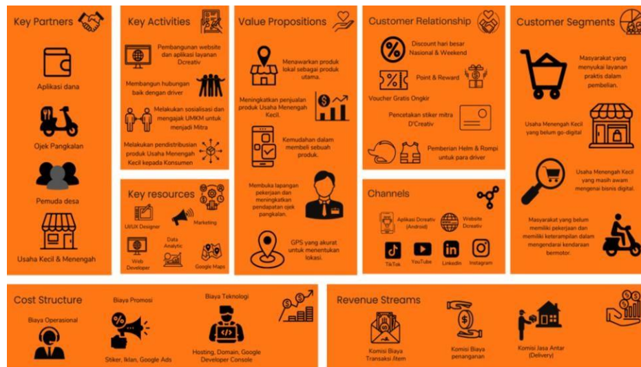
Gambar 1. 1 Business Model Canvas

Adapun Business Model Canvas yang digunakan oleh D’Creativ Indonesia dapat dilihat pada Gambar 1 berikut ini.