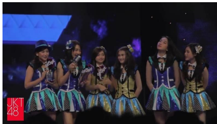
Gambar 1. 5 JKT48 River Memenangkan Penghargaan Lagu TerDahsyat 2014

Sesuai dengan hasil observasi yang peneliti langsungkan pada kanal Youtube resmi JKT48, peneliti menemukan beberapa lagu JKT48 dengan jumlah penonton terbanyak seperti pada gambar diatas. Lagu-lagu tersebut ialah “Heavy Rotation”, “Fortune Cookie”, dan “River”. Berdasarkan jumlah penonton di kanal YouTube resmi JKT48, “Heavy Rotation” memiliki 1.6 juta penonton, “Fortune Cookie” memiliki 7.8 juta penonton, dan “River” memiliki 7.5 juta penonton. Berdasarkan jumlah penonton pada video klip lagu-lagu tersebut, lagu “River” juga termasuk kedalam video klip lagu dengan yang terbilang banyak. Hal ini didukung oleh komentar-komentar para pendengarnya yang merasa disemangati oleh JKT48 melalui lagu “River”. Penyampaian pesan yang disampaikan oleh JKT48 melalui lirik lagunya membuat banyak orang termotivasi. JKT48 juga berhasil memenangkan penghargaan Lagu TerDahsyat untuk lagu “River” dalam acara DahSyatnya Awards 2014.