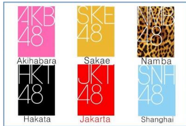
Gambar 1. 1 Sister Group 48 Family