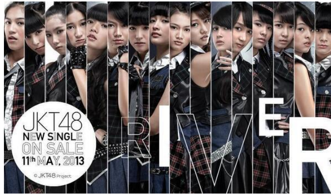
Gambar 1. 3 Poster Lagu River