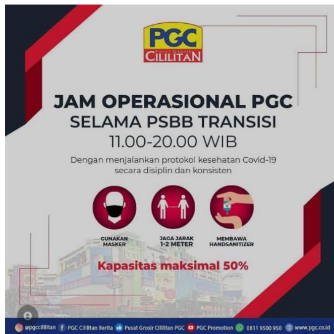
Gambar 1. 4 Jam Operasional Pusat Grosir Cililitan

Penutupan sementara Pusat Grosir Cililitan, tentunya menghambat operasional para tenant di tengah pandemi Covid-19. Hal tersebut terjadi hingga Juni 2020, saat Pusat Grosir Cililitan kembali dibuka dengan menerapkan kebijakan dan peraturan baru seperti pembatasan jumlah pengunjung dan waktu operasional tenant. Pusat Grosir Cililitan dengan menerapkan peraturan baru seperti membatasi jumlah pengunjung mall sebanyak 50% dan mengurangi waktu operasional setiap tenant.