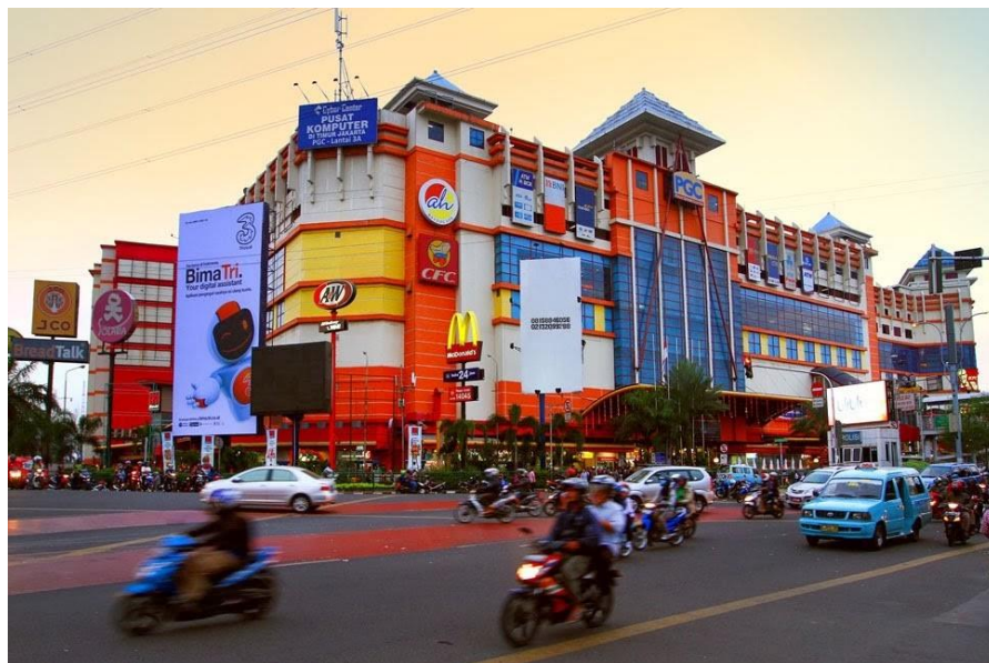
Gambar 1. 2 Pusat Grosir Cililitan

Pusat Grosir Cililitan (PGC) merupakan pusat perdagangan dan perbelanjaan terbesar di Jakarta Timur yang berdiri pada 30 April 2004. Sejak Januari 2007, PGC telah menjadi pusat perbelanjaan pertama yang tersambung dengan halte Transjakarta Cililitan. Halte busway bisa diakses melalui tangga dari lantai 2 PGC menuju jembatan penyeberangan yang sudah tersambung dengan tangga. Pada tahun 2009, PGC menjadi pusat perbelanjaan pertama yang mempunyai halte busway yang berada di dalam gedung. Selain dilalui oleh Transjakarta, PGC juga dilalui oleh Bus Kopaja, Bus Sekolah, Mikrolet, dan banyak kendaraan umum lainnya karena PGC berada di perempatan lampu merah Cililitan. Di dekat PGC juga terdapat terminal Trans Halim yang melayani anda untuk pergi ke Bandara Halim Perdana kusuma maupun ke daerah sekitar bandara dan ada juga bus Agra Mas Bandara yang melayani anda untuk pergi ke Bandara Soekarno-Hatta.