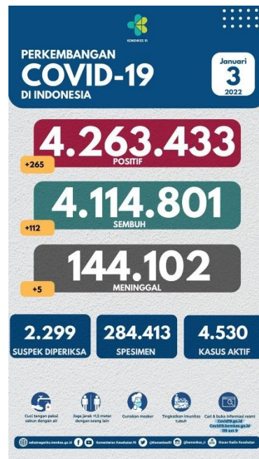
Gambar 1. 1 Data Kasus Covid-19 di Indonesia

Awal tahun 2020, masyarakat digemparkan dengan kemunculan virus corona yang berasal dari Wuhan. Virus ini kemudian mulai menyebar ke berbagai negara dan Indonesia menjadi salah satu negara yang penyebarannya meluas dengan sangat cepat dan salah satunya Ibu Kota Jakarta terkena dampaknya. Menurut data yang diambil dari official akun Twitter resmi Kemenkes RI, sejak munculnya pertama kali di Indonesia hingga 3 Januari 2022, ada sebanyak 4.263.433 orang yang terinfeksi covid-19.