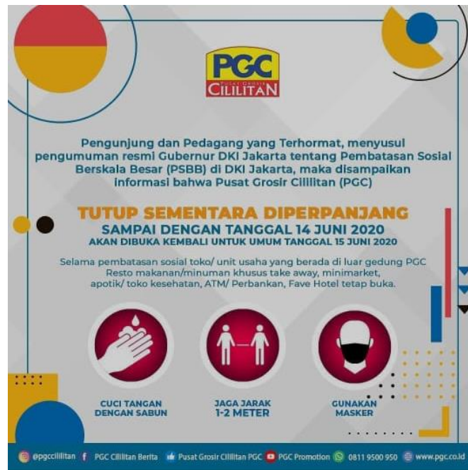
Gambar 1. 3 Informasi Penutupan Sementara PGC

penutupan sementara mulai 15 April hingga Juni 2020 guna mematuhi peraturan pemerintah dan hanya dapat menyediakan sejumlah tenant yang menjual kebutuhan dasar seperti kategori food & beverages, bank, dan farmasi melalui layanan pesan antar sedangkan bagi kategori beauty & health dan entertainment harus ditutup sementara.