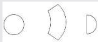
Gambar 1 : Bentuk geometris

Penerapan bentuk pada panti lansia yang akan dirancang dominan menggunakan bentuk dari geometris, yakni merupakan bentuk-bentuk yang beraturan, terstruktur dan umumnya merupakan bentuk yang simetris. Seperti pengembangan bentuk dari persegi dan lingkaran. Pemilihan bentuk geometris untuk panti, berdasarkan user (pengguna) panti yakni para lansia yang berdasarkan