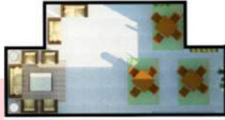
Gambar 12 : denah khusus ruang makan