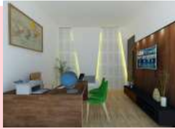
Gambar 14 : perspektif ruang kepala panti

Pada area tertentu seperti pada fasilitas hunian dan juga perantoran diperlukan material khusus untuk menahan kebisingan yang di timbulkan dari dalam maupun dari luar bangunan, material yang digunakan yaitu material menggunakan bahan akustik siap pakai seperti acoustical wall panel dengan berbagai cara pemasangan yaitu disemen pada permukaan padat, dipaku, dibor pada kerangka kayu atau dipasang pada system langit-langit gantung. Selain itu bentuk dari accoustical wall panel lebih dekoratif sehingga juga dapat berfungsi sebagai nilai estetika. Pemasangan acoustic wall dapat dilihat pada Gambar 14.