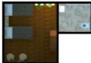
Gambar 11 : kamar lansia

Denah khusus yang dipilih pada perancangan ini yaitu area kamar lansia yang dapat dilihat pada Gambar 11 , kamar mandi lansia, ruang makan ( Gambar 12) , ruang keterampilan dan aula. Ruang keterampilan juga dipilih menjadi denah khusus karena untuk mendukung konsep mandiri panti sosial tresna werdha. Kamar mandi lansia juga dipilih menjadi denah khusus Karena memiliki perbedaan dengan kamar mandi pada umumnya.