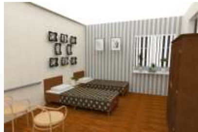
Gambar 13 : perspektif kamar tidur lansia

Warna yang di gunakan lebih dominan warna coklat pada denah , pada area kamar lebih dominan warna biru namun tetap menimbulkan warna coklat untuk memberikan kesan natural. penambahan warna netral seperti putih serta warna aksen seperti warna biru dan hijau penambahan material alam untuk menimbulkan suasana natural namun tetap homey didalam perancangan. Terdapat pot tanaman yang diletakkan pada ambalan yang ditambahkan dijendela, selain untuk memberikan kesan natural transquilty juga agar lansia dapat memelihara makhluk hidup yang memotivasinya untuk menjalankan hidup dan juga memberikan aromatherapy pada kamar lansia. Tata ruang pada ruang kamar lansia dapat dilihat pada Gambar 13.