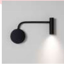
Gambar 10 : Bathroom task lighting