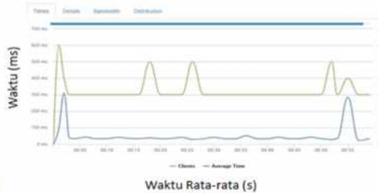
Gambar 2 Pengujian server stress

Berdasarkan hasil pengujian pada gambar 4.1 dengan skenario pengujian skema 200 akses pengguna virtual dalam satu menit didapatkan penggunaan klien yang stabil dengan average time .