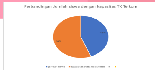
Gambar 1.2 Perbandingan Jumlah Siswa dan Kapasitas Kelas

sampai tiga tahun), Kelompok A (untuk usia empat sampai lima tahun), Kelompok B (untuk usia lima sampai enam tahun). Adapun jumlah siswa TK Sandhy Putra Dayeuhkolot adalah sebanyak 20 siswa. dimana 9 siswa diantaranya merupakan siswa Kelompok A, 9 siswa lainnya siswa Kelompok B, serta 2 siswa lainnya berada di kelas Kelompok Bermain. Gambar 1.2 menunjukkan perbandingan antara Jumlah siswa dengan kapasitas siswa kelas yang ada di TK Telkom.