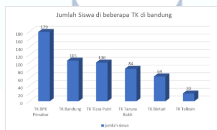
Gambar 1.3 Jumlah Siswa di berbagai TK di Bandung

Bedasarkan gambar 1.2 di atas dapat diketahui bahwa jumlah siswa TK Telkom hanya 44 % dari jumlah kapasitas yang ada di TK Telkom. Indikasi permasalahan TK Telkom adalah masih rendahnya siswa di TK Telkom yang hanya 44 % dari jumlah kapasitas yang ada . Didukung juga dengan sedikitnya jumlah siswa yang ada di TK Telkom dibandingkan dengan jumlah siswa TK lain yang berada di Kota Bandung. Gambar 1.3 menunjukkan jumlah siswa di beberapa TK di Bandung.