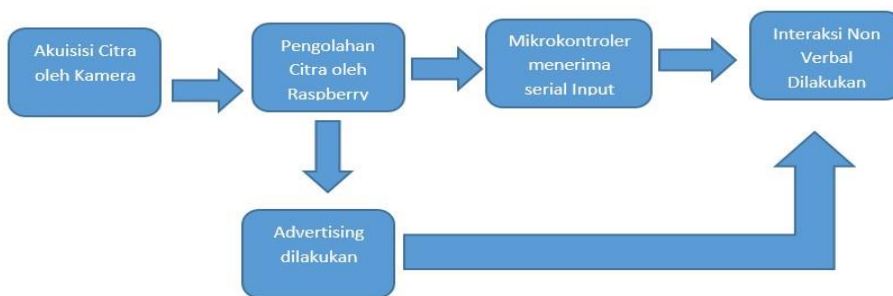
Gambar 3.2 Diagram blok sistem

Sistem HRI yang di bangun memiliki beberapa tahap, yaitu akuisisi citra, pengolahan citra. Berikut merupakan blok diagram dari sistem yang akan dibangun: