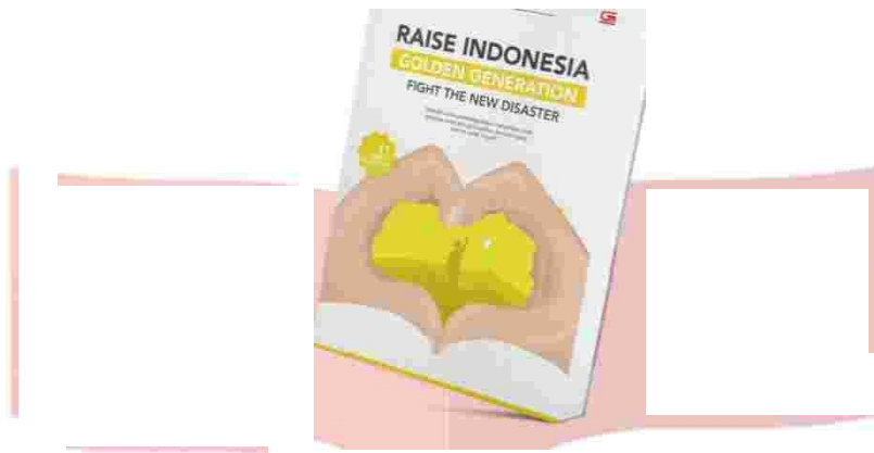
Gambar 1. Buku Parenting

7 Pilar tersebut yaitu A) Kesiapan menjadi orangtua, B) Mengokohkan peran ayah dalam pengasuhan, C) Tujuan pengasuhan yang jelas, D) Komunikasi baik, benar & menyenangkan, E) Penanaman nilai agama, F) Mempersiapkan anak baligh, G) Bijak berteknologi. Buku yang dirancang berukuran A5 (14,85cm x 21cm) dengan material kertas menggunakan bahan tintoretto 95gr. Buku berisikan 130halaman dengan setiap halaman memiliki penjelasan ilustrasi dan visual yang dapat membantu para pembaca dalam memahami konten edukasi yang ada.