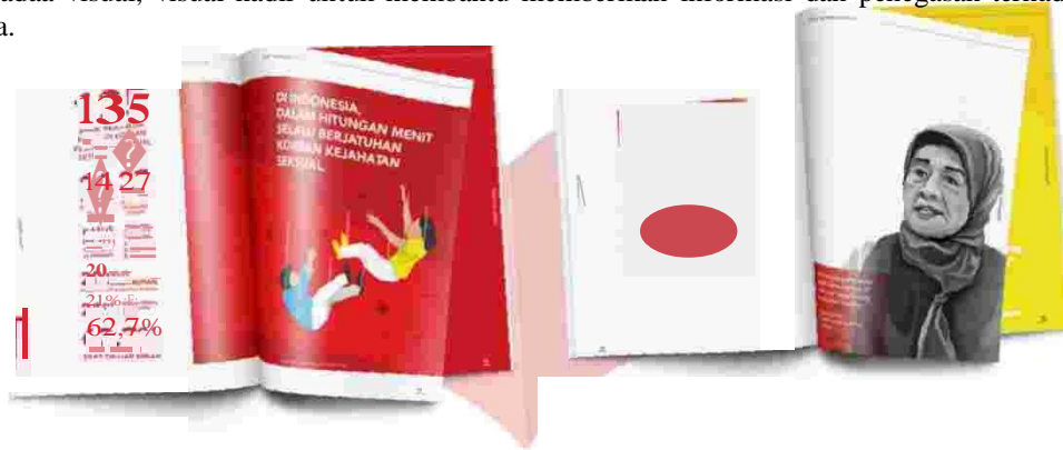
Gambar 5. Halaman isi buku hasil perancangan

Perancangan buku yang dirancang menggunakan konsep layout semi majalah. Dimana alur pembacaan konten serta materi buku yang ada dibuat senyaman mungkin terhadap target tujuan. Tujuan dari dirancangnya buku edukasi yang penuh dengan aspek visual yaitu menghindari kejenuhan para orangtua dan calon orangtua dalam mempelajari dan memahami konten parenting yang sudah di konsepkan. Dengan memberikan aspek visual didalamnya yaitu memaksimalkan ruang sebagai letak ilustrasi dan penggunaan typography yang berfungsi sebagai penegas materi konten. Orangtua dan calon orangtua saat ini sangat haus akan keberadaa visual, visual hadir untuk membantu memberikan informasi dan penegasan terhadap materi yang tertera.