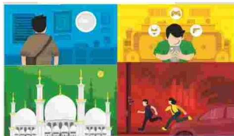
Gambar 2. ilustrasi konten dalam buku

Dengan mengambil judul perancangan buku yaitu Raise Indonesia Golden Generation, Fight The New Disaster adalah bentuk pergerakan positif dalam mencegah dan menjauhkan sang buah hati dari ancaman kejahatan seksual maupun terjadinya bencana kerusakan otak yang diakibatkan oleh konten-konten media yang negatif. Dengan ilustrasi tangan yang menggunakan teori gestalt didalamnya, terdapat siluet muka 2 anak laki-laki dan perempuan yang saling menghadap ke satu sisi yang lain. Ilustrasi tersebut mengomunikasikan bahwa tanggungjawab, pengasuhan, dan hal-hal yang berkaitan dengan masa depan sang buah hati berada didalam tangan sang orangtua yang membesarkannya. Orangtua wajib melindunginya, mendidiknya, serta membimbingnya. Didalam siluet tersebut terdapat ilustrasi seorang anak yang berdiri tegap mengahap kelangit dengan tangan menggenggam keatas seraya memperlihatkan ketangguhan seorang anak dalam menghadapi bencana dan kejahatan yang ada disekitarnya. Sang buah hatilah yang nantinya akan menjadi pemimpin dimasa depan dengan ketangguhan diri serta kesiapan konsep diri.