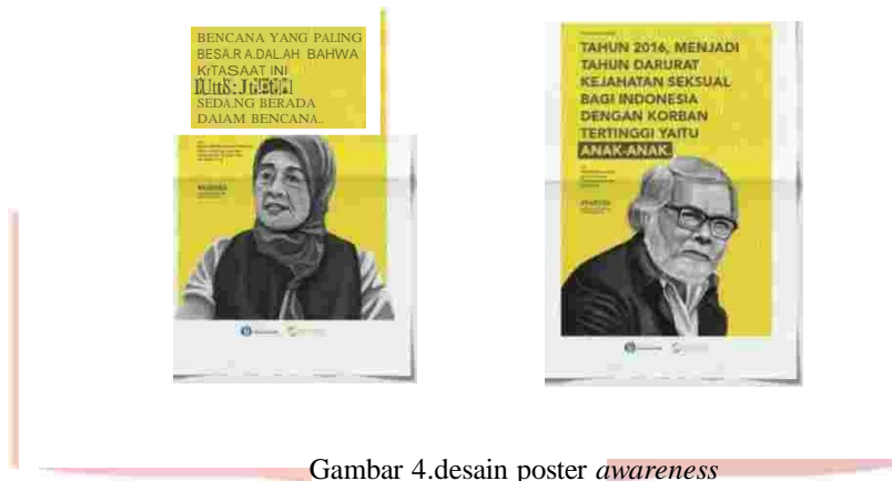
Gambar 4. desain poster awareness

Aktivasi sosial media melalui facebook, twitter, dan instagram merupakan bentuk publisitas permasalahan dan kehadiran buku edukasi. Sosial media memiliki kekuatan dalam menarik perhatian target tujuan dengan sangat cepat dan mudah.