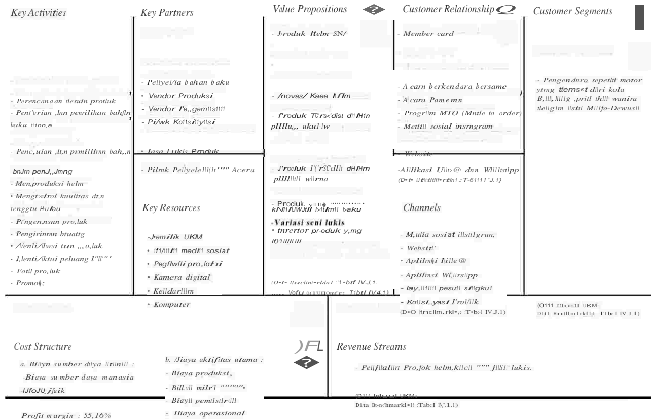
Gambar 3.1 Peta Model Bisnis Kanvas UKM Wheelhouse