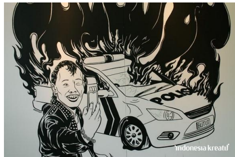
Gambar 3. Untitled