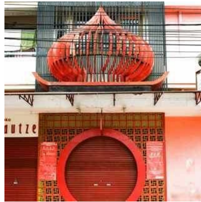
Gambar 2. Homeland, Beliefs, Personal God(s) #21