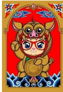
Gambar 5. Manekipetpet