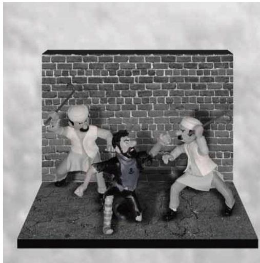
Gambar 1. Front Pembela Tintin.