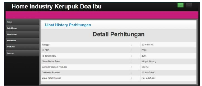
Gambar 3 Halaman Hasil Perhitungan EPQ

Halaman dari hasil perhitungan EPQ seperti terlihat pada gambar 4.