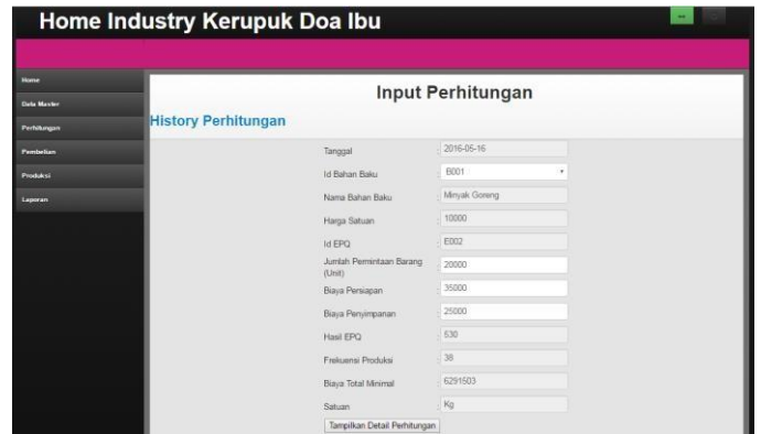
Gambar 2 Halaman Perhitungan EPQ

Halaman dari perhitungan EPQ seperti terlihat pada gambar 3.