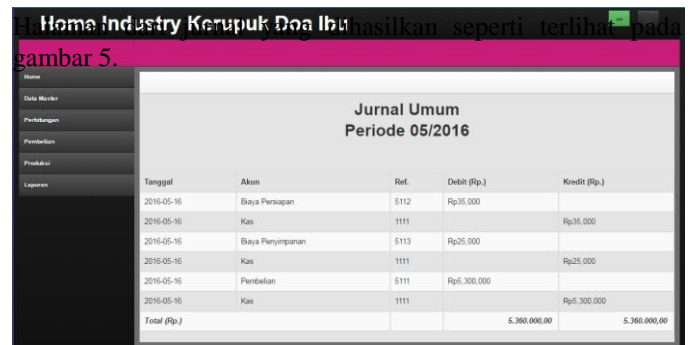
Gambar 4 Halaman Jurnal