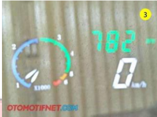
Gambar 1. Tampilan Head Up Display

Head up display adalah tampilan transparan yang menyajikan informasi tanpa mengharuskan penggunanya untuk melihat dari sudut pandang yang biasa. Head up Display (HUD) sudah digunakan pertama kali pada pesawat. HUD sudah digunakan dalam dunia otomotif sejak tahun 1988 oleh general motors. HUD dapat menampilkan informasi kendaraan pada kaca depan, langsung pada area pandang pengemudi dan tak perlu lagi menunduk atau mengalihkan pandangannya dari jalan di depannya. hal itu lah yang membuat HUD memiliki prospek menjanjikan.[2]