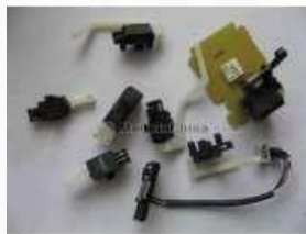
Gambar 2. Sensor

Sensor merupakan alat yang berfungsi sebagai pendeteksi perubahan energi fisika, energi kimia, energi biologi dan energi mekanik yang diubah menjadi suatu besaran elektrik.[4]