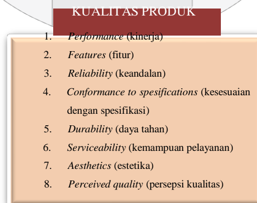
Gambar 2. Kerangka Pemikiran

Delapan dimensi kualitas produk yang telah dijabarkan akan digunakan untuk mengetahui pendapat kosnumen tentang kualitas produk PC tablet iPad Air 2 dan Samsung Galaxy Tab S 10.5. Hasil penelitian ini dapat diketahui ada atau tidaknya perbedaan kualitas produk kedua PC tablet menurut konsumen, sehingga setiap perusahaan dapat membuat strategi untuk mempertahankan atau meningkatkan kualitas pada produk masing-masing. Berikut adalah kerangka pemikiran penelitian yang digunakan: