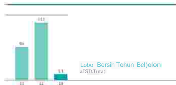
Gambar 1 Laba bersih PT. Garuda Indonesia tahun 2011-2013

(Sumber: Laporan Tahunan 2013 PT. Garuda Indonesia Tbk.)