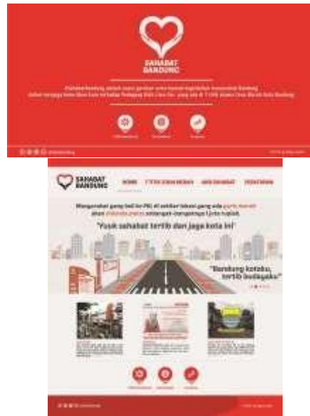
Gambar 17. Website #sahabatbandung