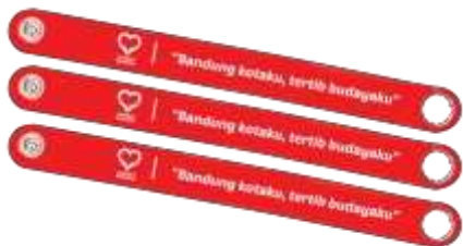
Gambar 16. Notes