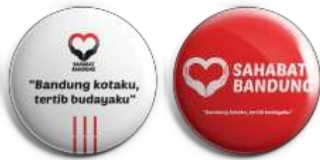
Gambar 14. Pin #sahabatbandung