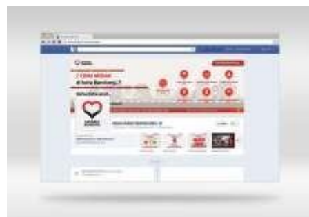
Gambar 19. Facebook #sahabatbandung