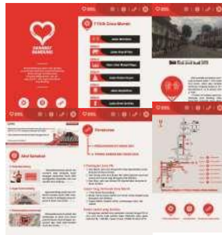
Gambar 18. Aplikasi #sahabatbandung