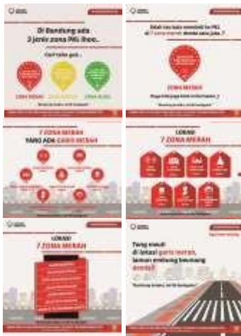
Gambar 8. E-Poster #sahabatbandung