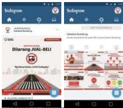
Gambar 21. Instagram #sahabatbandung