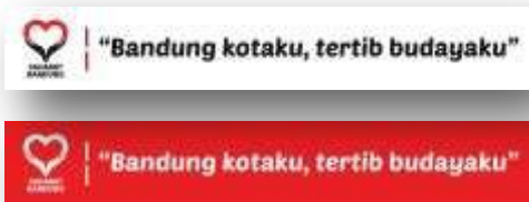
Gambar 15. Sticker #sahabatbandung