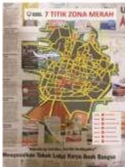
Gambar 9. Iklan Koran #sahabatbandung