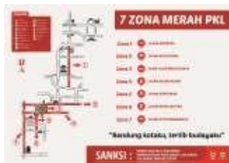
Gambar 2. Lokasi tujuh zona merah

Pedagang Kaki Lima merupakan suatu usaha kecil sektor informal yang keberadaannya dapat menyerap tenaga kerja terutama tenaga kerja dengan pendidikan rendah. Pedagang Kaki Lima mampu menyediakan dan menjajakan barang-barang nya dengan murah dan terjangkau.