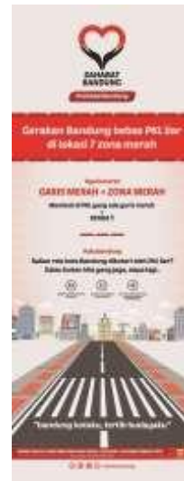
Gambar 12. X-banner #sahabatbandung