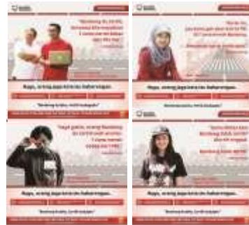
Gambar 11. E-poster persuading