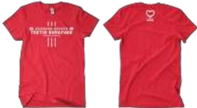
Gambar 13. T-shirt #sahabatbandung