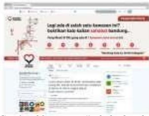
Gambar 20. Twitter #sahabatbandung