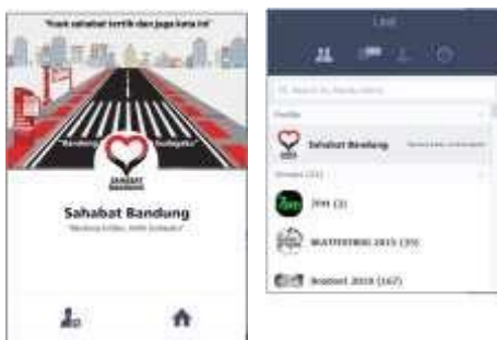
Gambar 22. Line #sahabatbandung