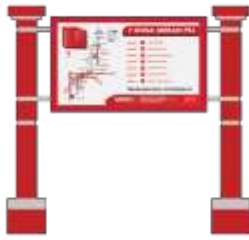
Gambar 7. Signage Sahabat Bandung