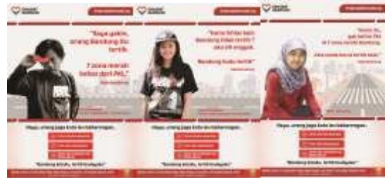
Gambar 10. Billboard #sahabatbandung