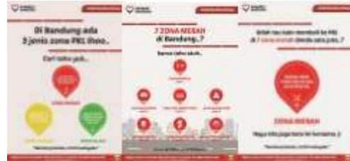
Gambar 5. Poster #sahabatbandung