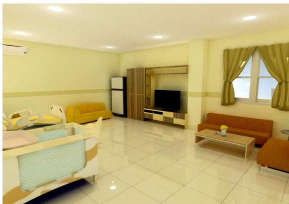
Gambar 5. Rawat Inap Ibu (VIP) RSIA Hermina Pateur Bandung