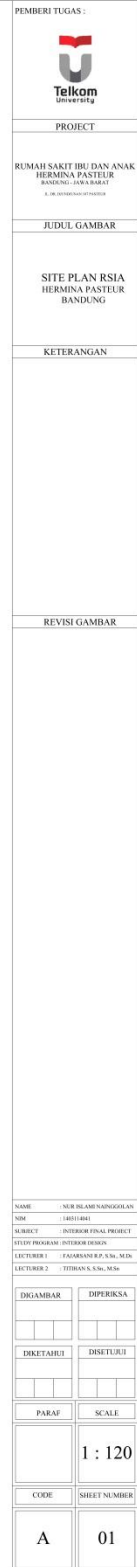
Gambar 1. Site Plan RSIA Hermina Pateur Bandung