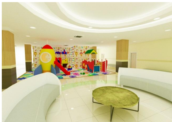
Gambar 4. Playground