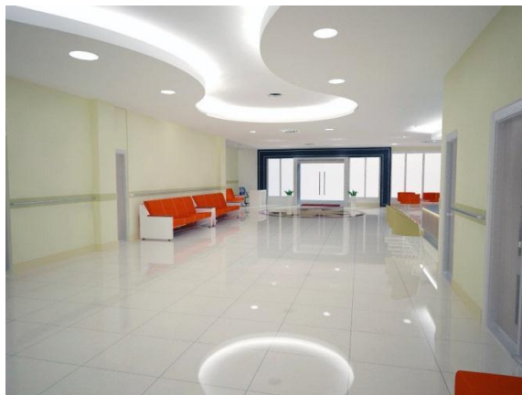
Gambar 2. Lobby / Information RSIA Hermina Pateur Bandung