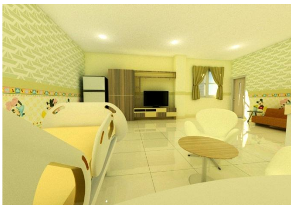
Gambar 6. Rawat Inap Anak (VIP) RSIA Hermina Pateur Bandung