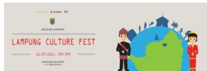
Gambar 6. Spanduk