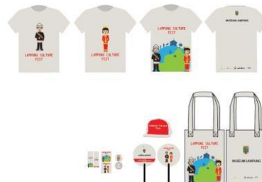
Gambar 10. Souvenir