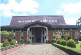
Gambar 1. Museum Tampak depan