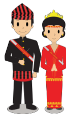
Gambar 2. Maskot