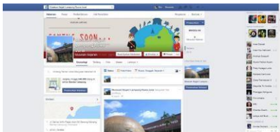
Gambar 8. Facebook