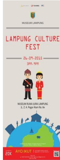
Gambar 5. X-Banner