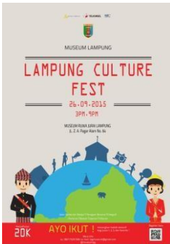
Gambar 4. Iklan Majalah