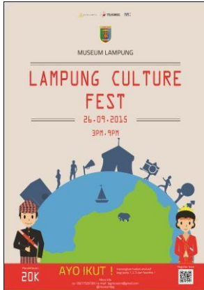
Gambar 3. Poster