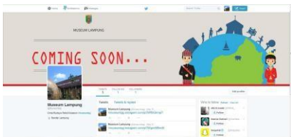
Gambar 9. Twitter