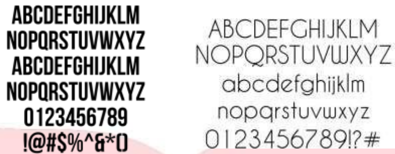
Gambar 1. Jenis Huruf