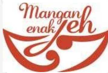
Gambar 3. Logo Aplikasi Kuliner Khas Cirebon "Mangan Enak Jeh"

Logo untuk promosi kuliner khas Cirebon ini merupakan gabungan dari dua jenis logo, yaitu logotype dan logogram .