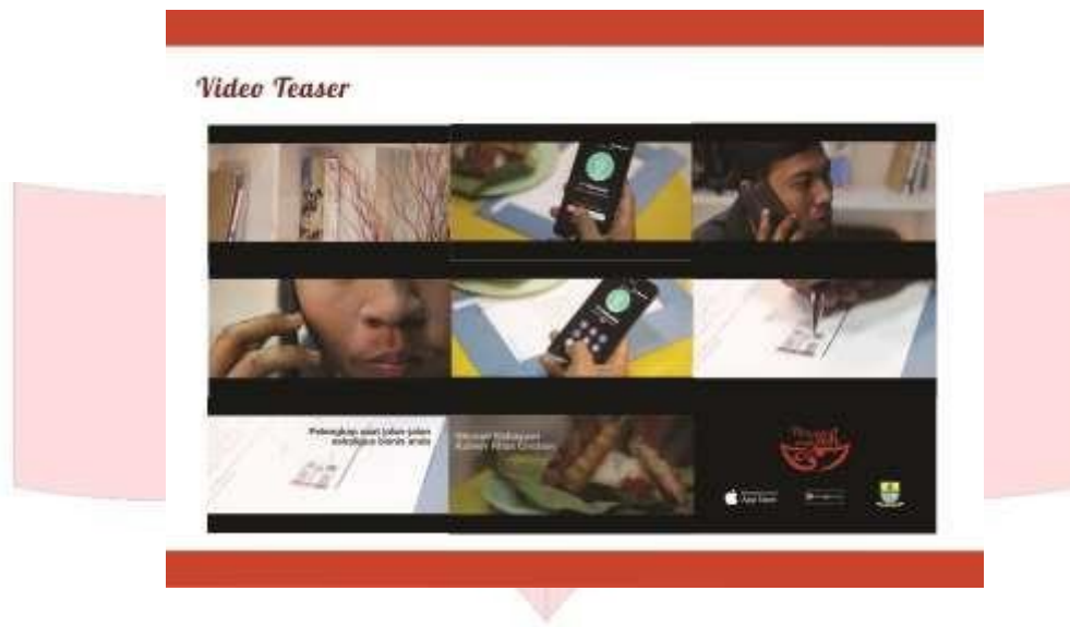
Gambar 6. Screenshoot Video