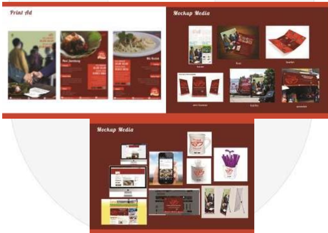
Gambar 5. Media Pendukung