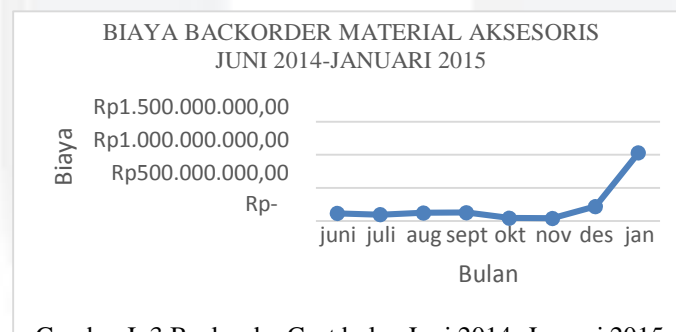
Gambar I. 3 Backorder Cost bulan Juni 2014- Januari 2015

Dilihat dari Gambar I.2 menunjukkan bahwa, permintaan material aksesoris dari cabang xxx belum bisa terpenuhi dilihat dari kondisi stok di gudang aksesoris yang relatif rendah sehingga menyebabkan terjadinya stockout . Dengan adanya fenomena stockout , pihak pengelola gudang melakukan pemesanan kembali ( backorder ) untuk memenuhi kebutuhan permintaan customer. Berikut data backorder cost yang harus dilakukan perusahaan pada bulan Juni 2014 – Januari 2015 :