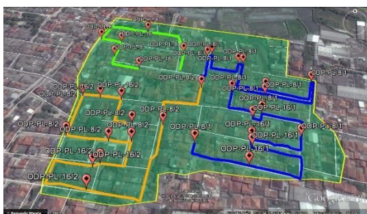
Gambar 4.3 Distribusi perancangan

Perhitungan redaman untuk jaringan ini dibutuhkan karena dengan didapatkannya redaman yang sesuai dengan range yang ditentukan yaitu 13 – 25 dB maka jaringan tersebut bisa dikatakan bagus atau tidak akan terjadi gangguan secara teknikal dari media transmisi.