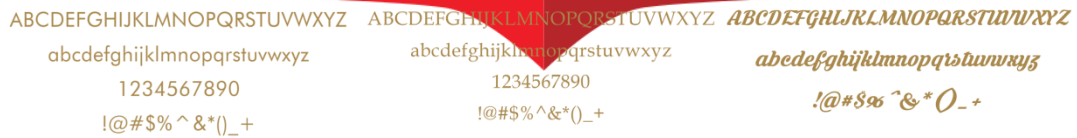
Gambar 3. Tipografi

Tipografi yang digunakan dalam perancangan ini terdiri dari 3 jenis font, yang pertama adalah Krines Regular Personal Use , Book Antiqua , dan yang terakhir adalah Futura BK BT .