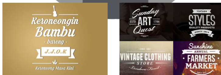
Gambar 1. Logo & Refrensi

logo dari acara ini mengedepan kesan klasik namun moderen. Di bagian atas terdapat visualisasi dari alat musik keroncong yaitu “Cak” yang menjadi perwakilan dari musik keroncong. Di bagian bawah terdapat visualisasi sebuah daun bambu yang menjadi perwakilan dari bahan dasar bambu.