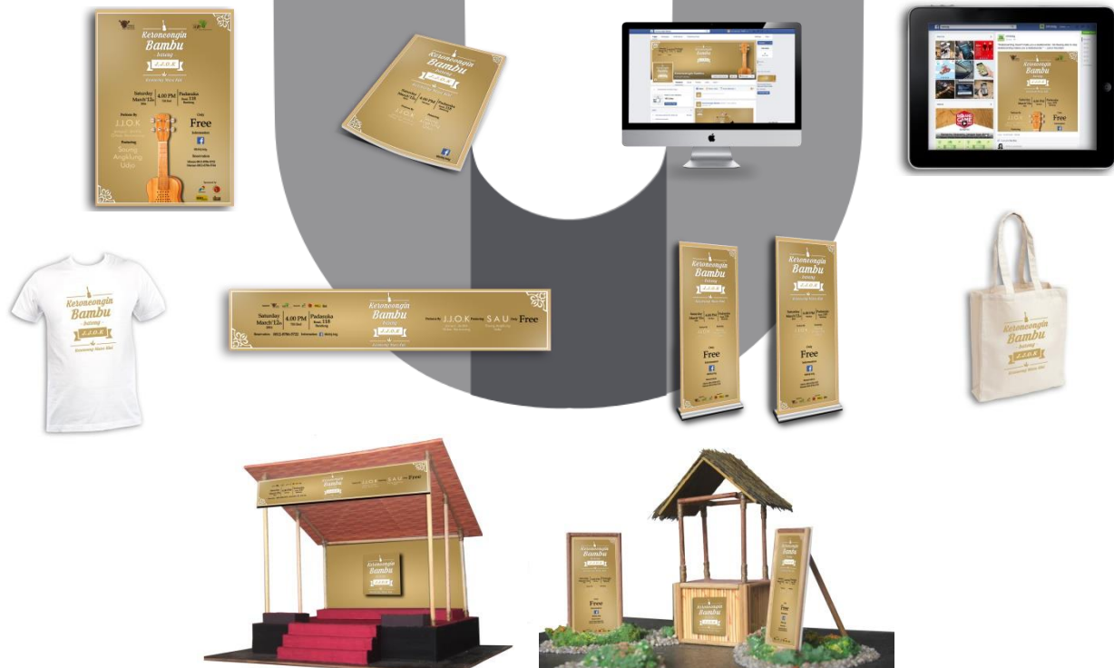
Gambar 4. Visualisasi Karya