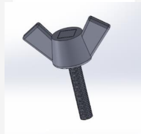
Gambar 2 Baut Handle Pada Toolpost

Penggantian peralatan secara cepat yang dilakukan adalah dengan penghapusan kegiatan mengambil tools pengunci chuck dan pengunci toolpost yang diganti dengan menerapkan penggunaan pengunci dengan handle yang menempel pada baut pengunci. Sehingga operator tidak perlu lagi mengambil pengunci jika ingin melakukan setup .